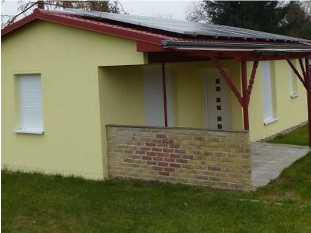
Bungalow mit überdachter Terrasse