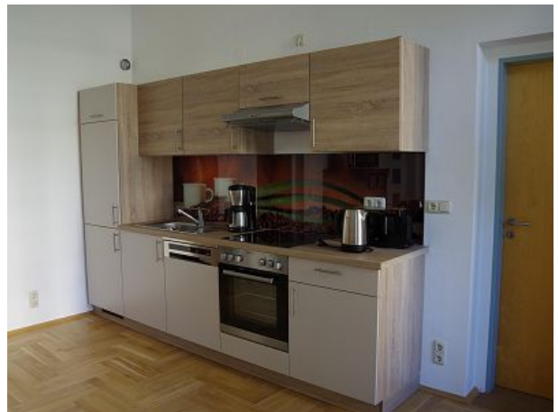
Noch ein Blick in die Küche