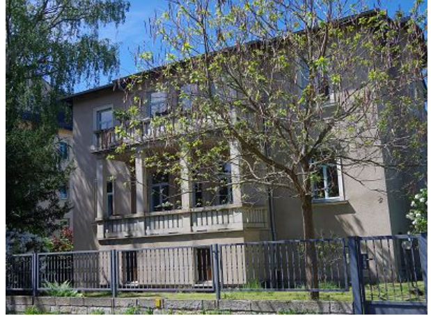
Unser Haus von vorn