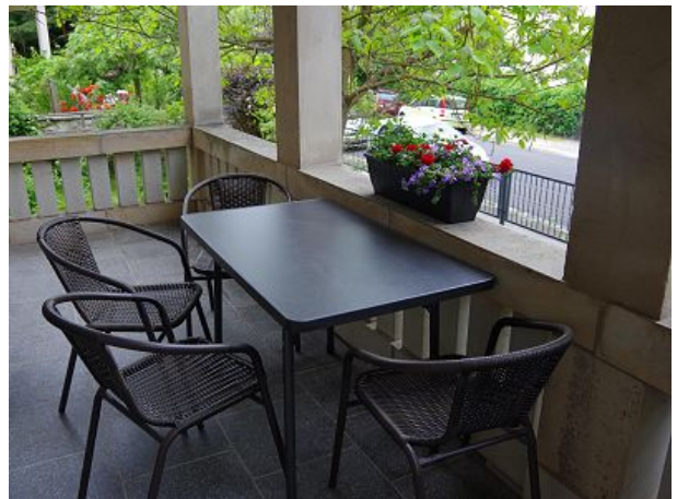
Balkon im Grünen