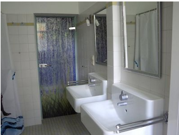
Blick ins Bad