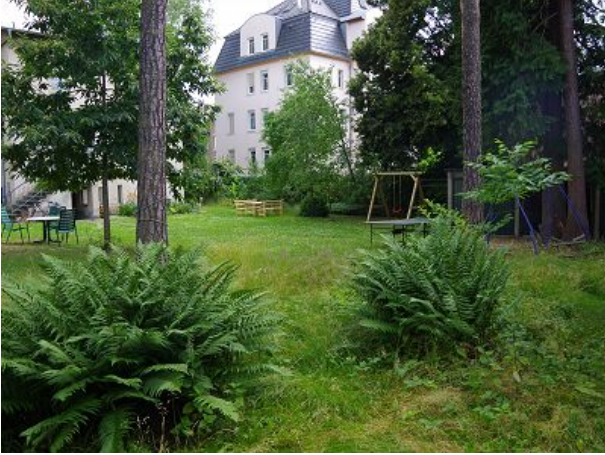
Schaukel und Tischtennisplatte