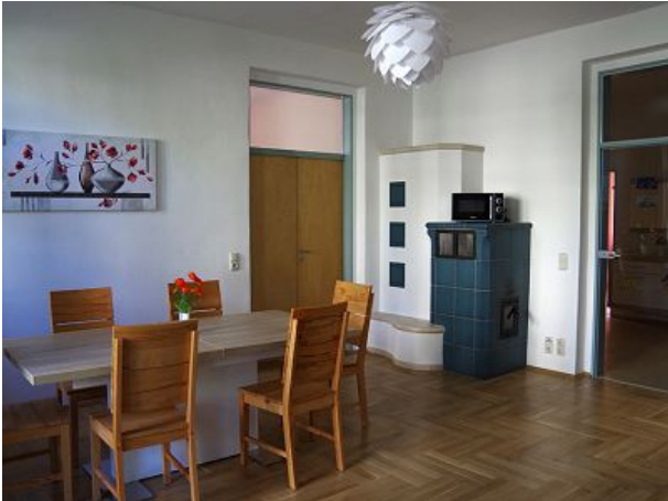
Die große Wohnküche