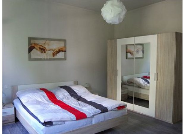
Schlafzimmer eins mit Doppelbett