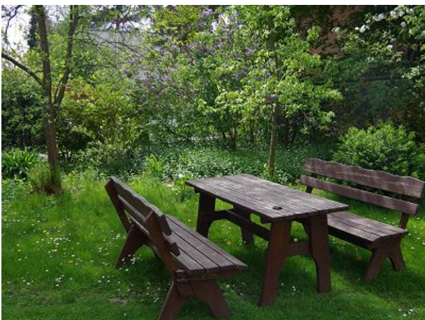
Die Bank für unsere Gäste auf dem Hof