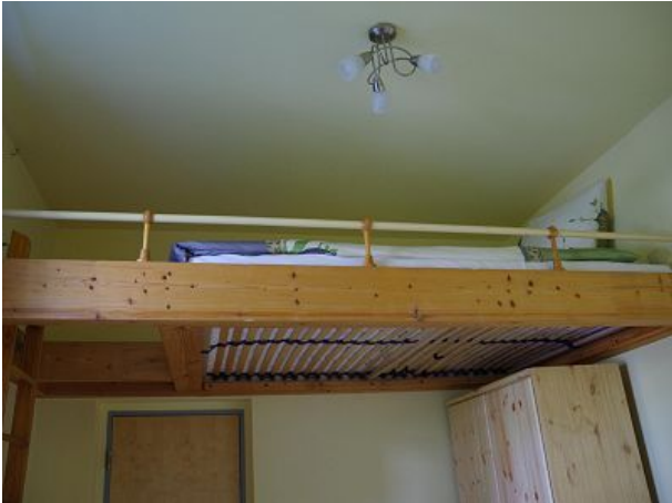
Hochbett im Kinderzimmer