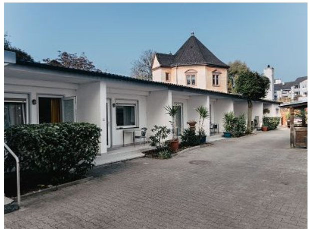
Das Gelände tagsüber