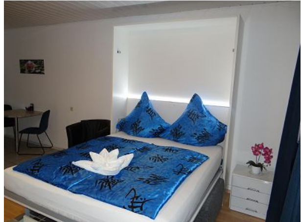
Das exklusive Doppelbett