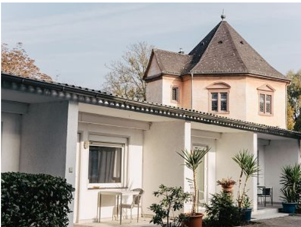
Das Gelände tagsüber