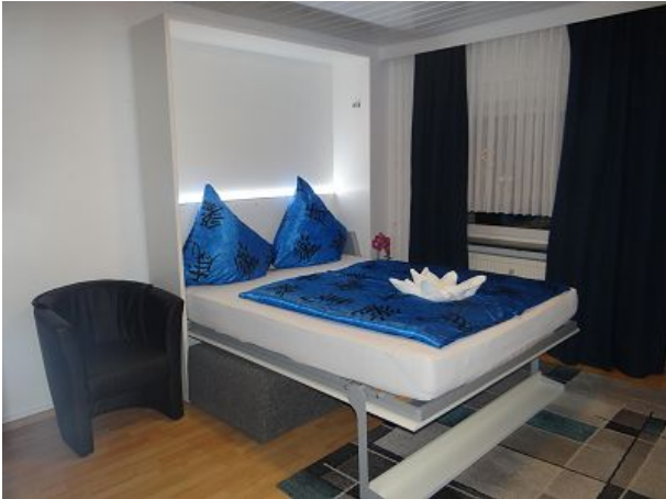
Das exklusive Doppelbett