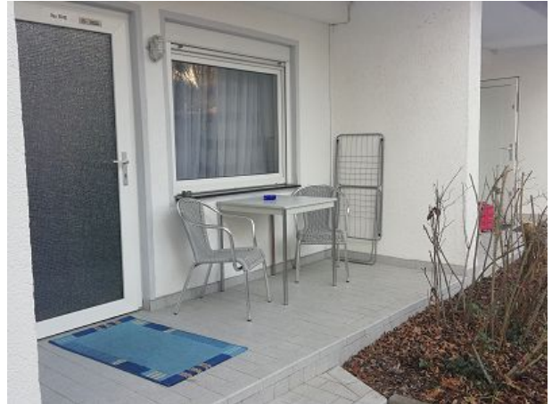
Die Terrasse vor dem Apartment