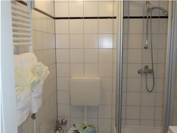
Die Toilette und die Dusche