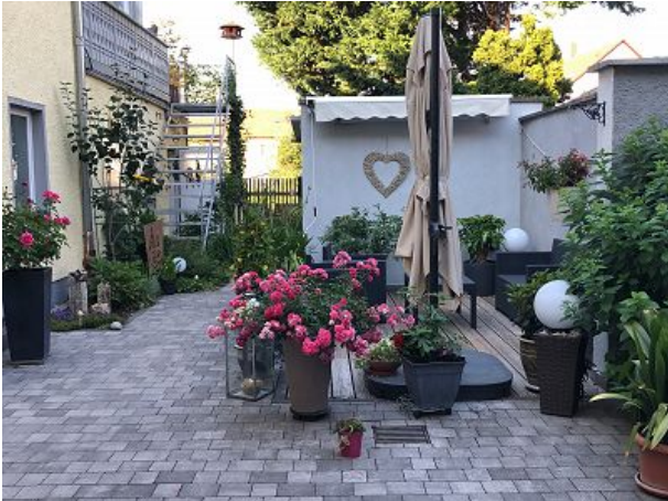
Bereich zum Verweilen