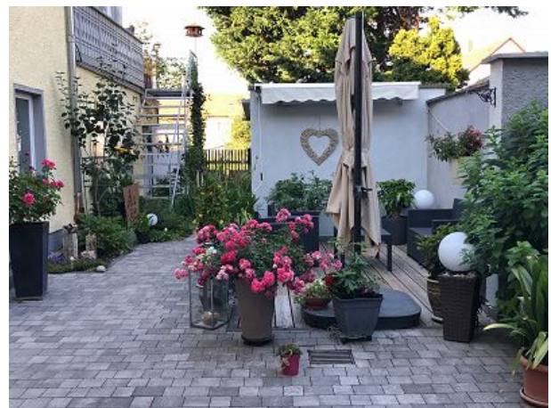
Aussenbereich zur Erholung