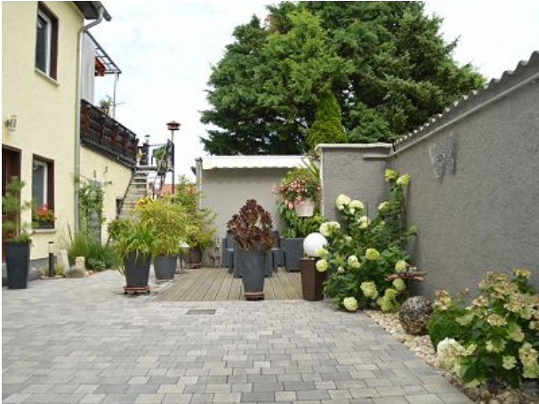
Für gemütliche Abendstunden