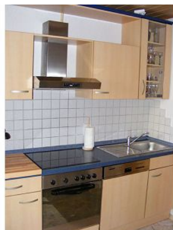
Küchenzeile mit Backofen Geschirrspüler