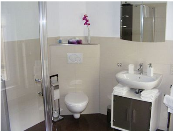
Bad mit WC und Waschtisch