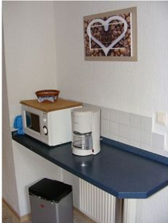
Küche mit Mikrowelle und Kaffeemaschine