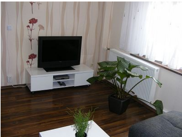
Wohnbereich mit Tv und Anlage