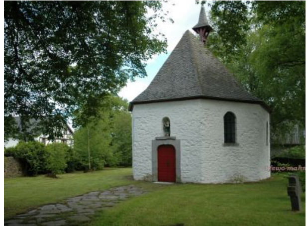
Alte Kapelle in Roetgen