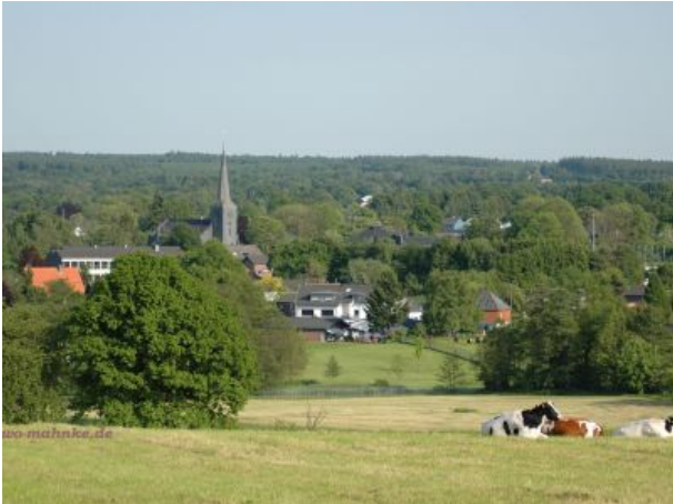
Roetgen vom Eifelsteig aus gesehen