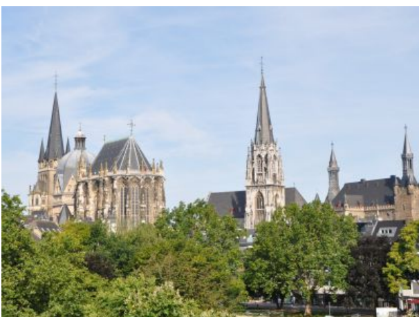
Dom zu Aachen