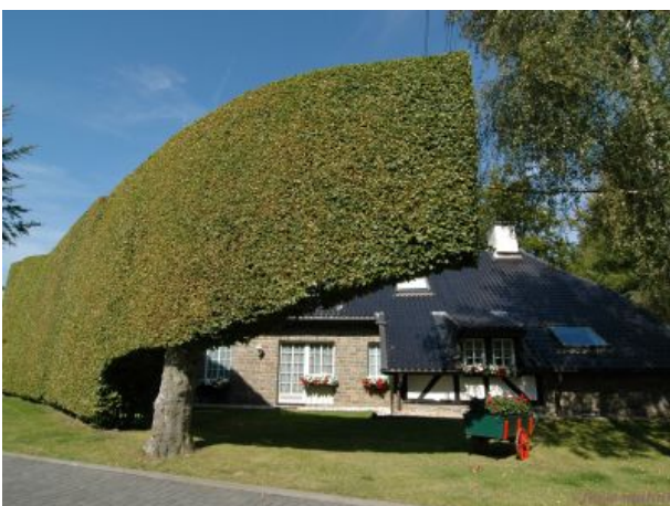
Hecke in Höfen