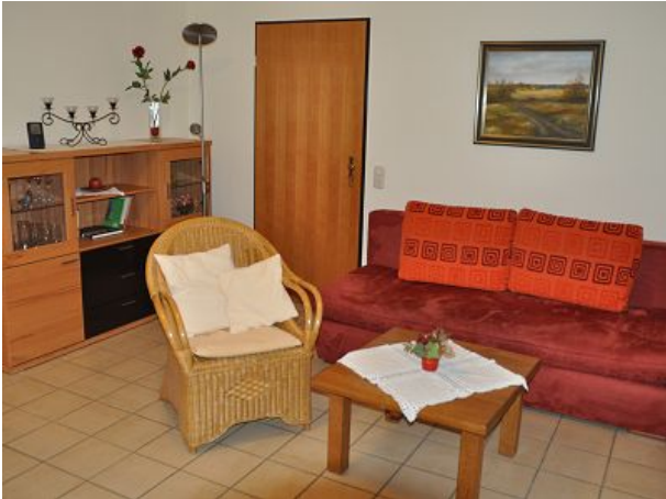
Fernsehessel und Sofa