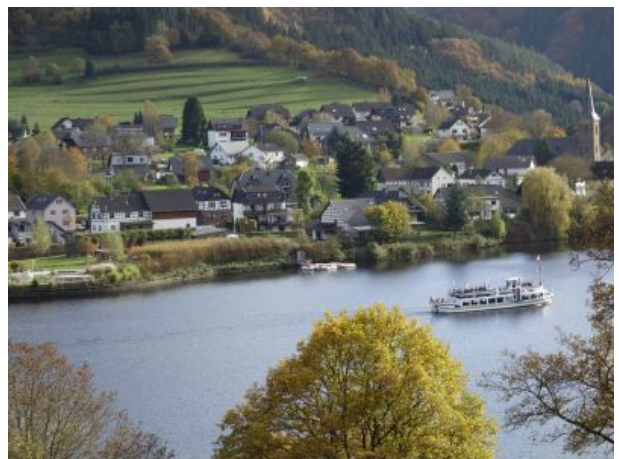
Obersee mit Einruhr