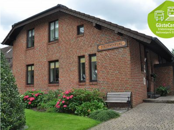
Haus von der Straße aus gesehen