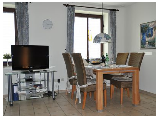
Großer Tisch mit TV