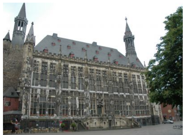
Rathaus in Aachen