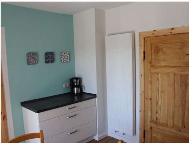
Schöne Farben und natürliche Elemente