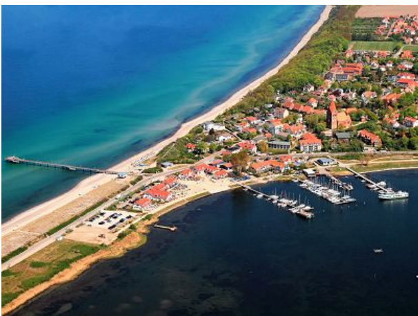
Meine Heimat aus der Luft