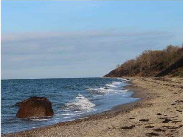
Einsame Spaziergänge möglich