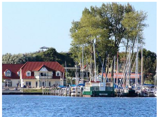
Hafen im Salzhaff