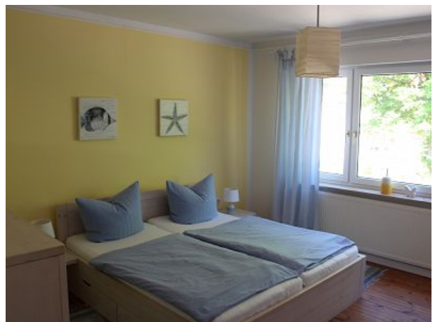
Einschlafen beim Rauschen des Meeres