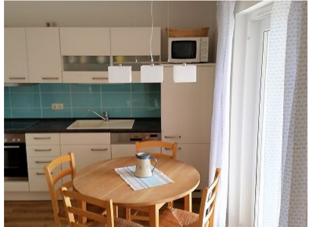
Komplett ausgestattete Küche