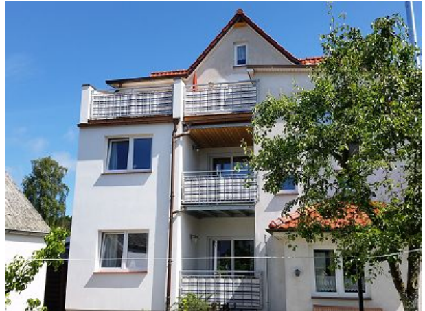
In der Mitte die Wohnung Gaude Tied