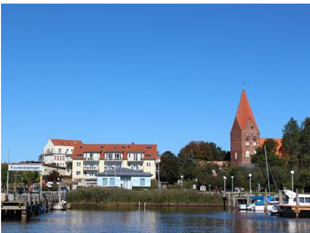
Blick auf die Kirche vom Salzhaff