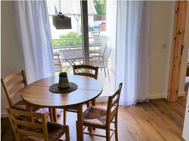
Nehmen Sie Platz