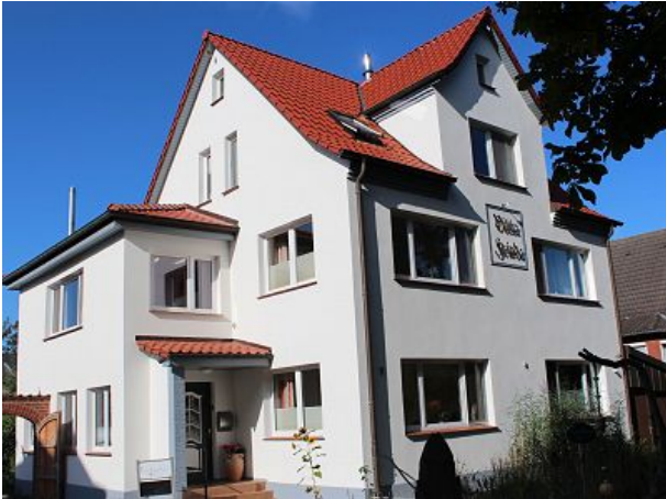
Villa Frieda auf dem Fischereihof