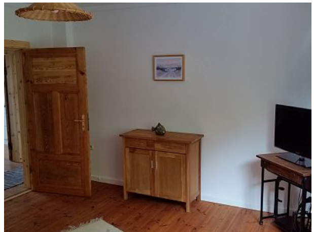
Viele natürliche Elemente