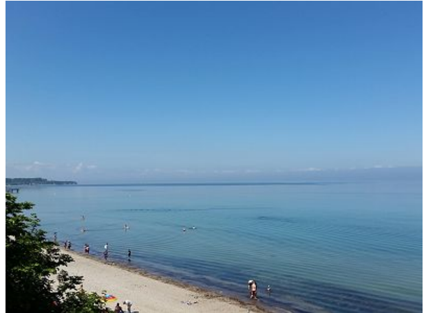
Naturstrand an der Ostsee