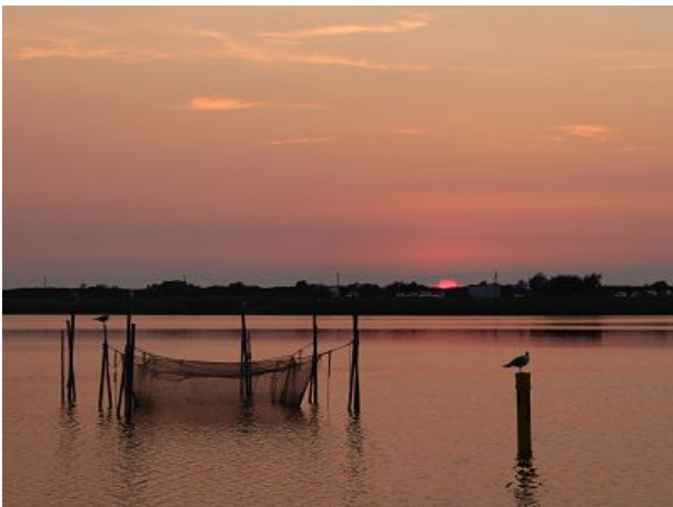
Abendstimmung am Salzhaff