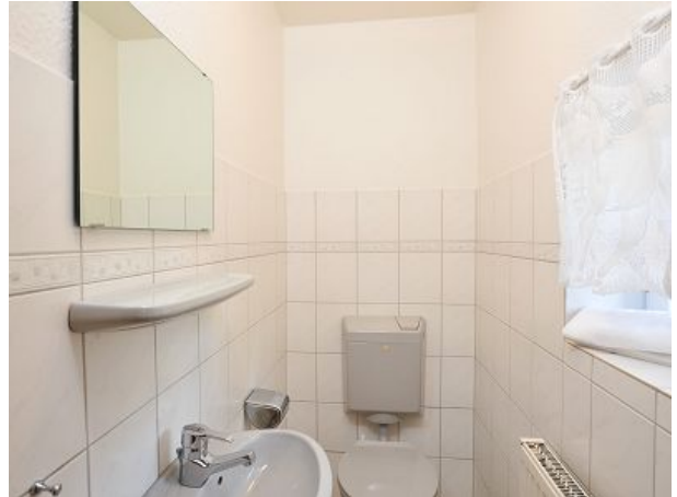
Gwc im Eg