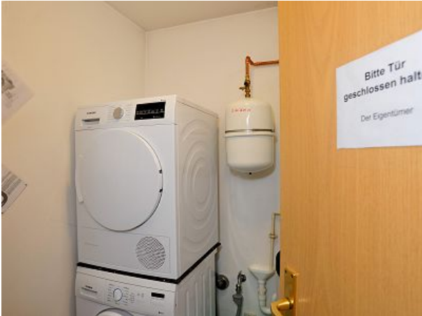
Wm und Trockner von Küche