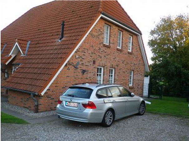
Parkplatz zum Haus