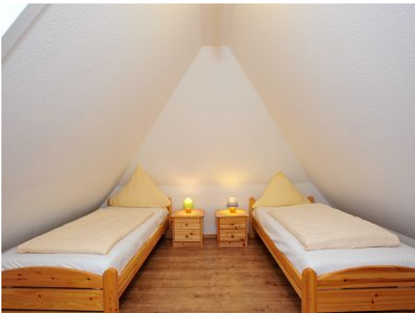
Schlafzimmer beonders Kinder geeignet