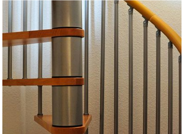
Treppenaufgang zum DG Kinder