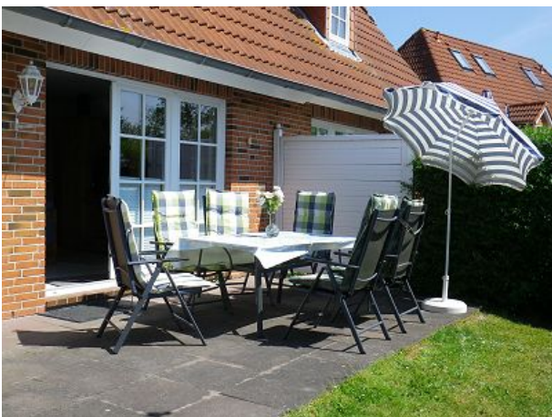
Garten Südterrasse voll eingezäunt