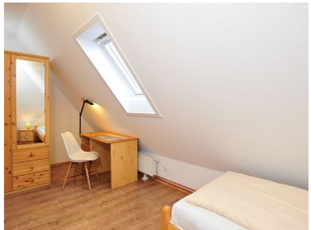
Schlafzimmer besonders Kinder geeignet