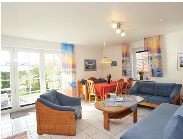
Wohnen und Essen zur Terrasse