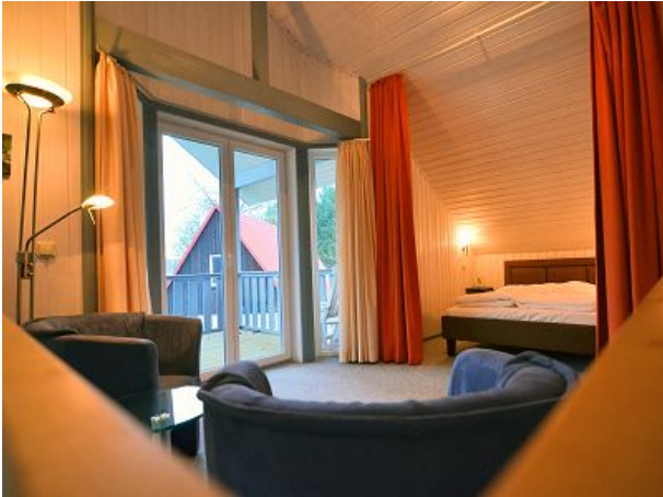
Zweite Sitzecke mit Doppelbett OG