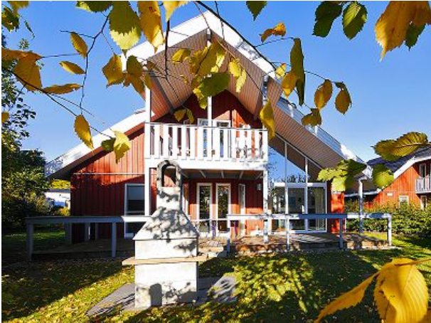
Ferienhaus Außenansicht Grill u Terrasse