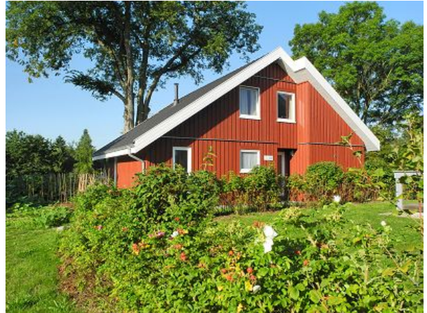
Ferienhaus Außenansicht Garten