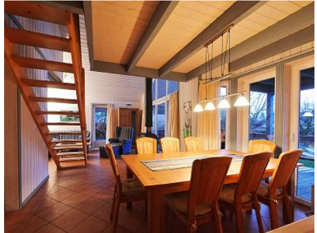
Tisch ausziehbar zehn Personen