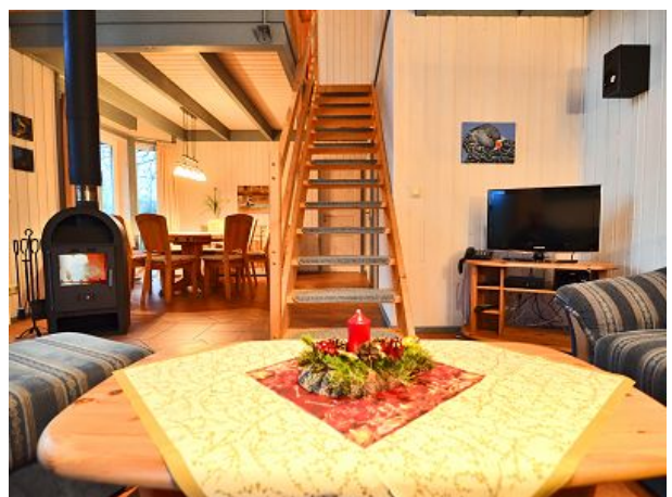
Komierter Wohn- und Essraum