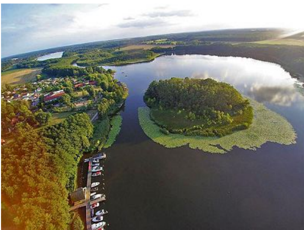
Unser Ferienhaus liegt am Granzower See