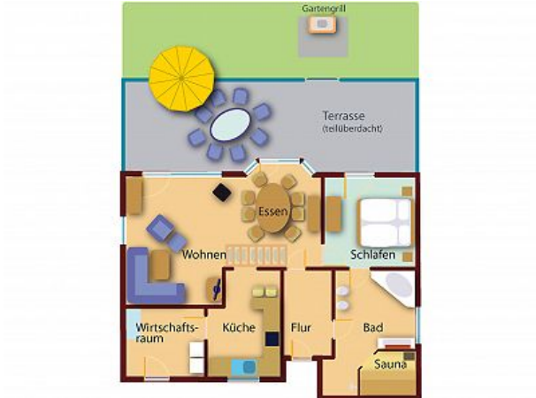
Grundriss Ferienhaus UG