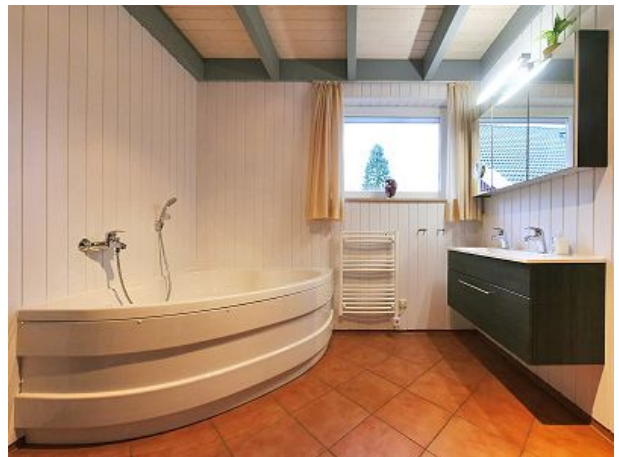
Bad UG Whirlpool Sauna Dusche