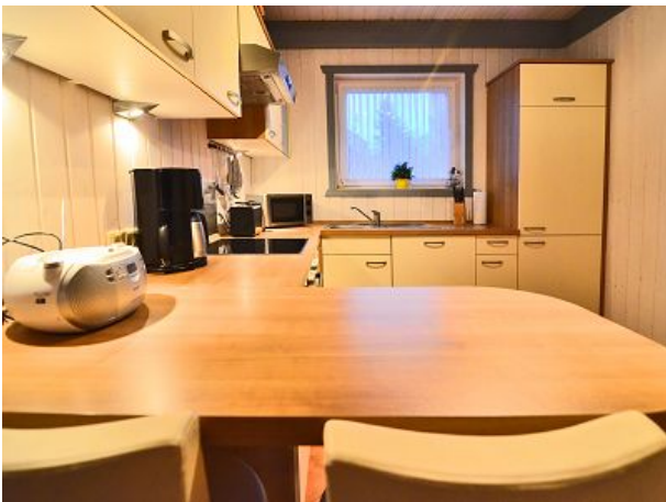
Küche Geschirrspüler Kühlkombi