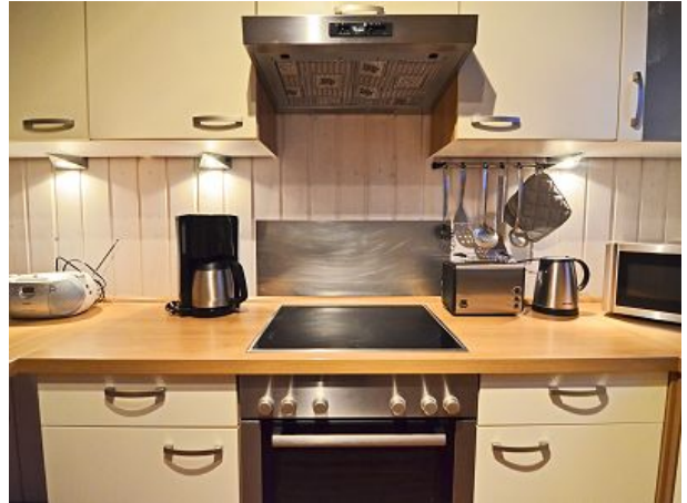
Küche Herd Backofen Mikrowelle