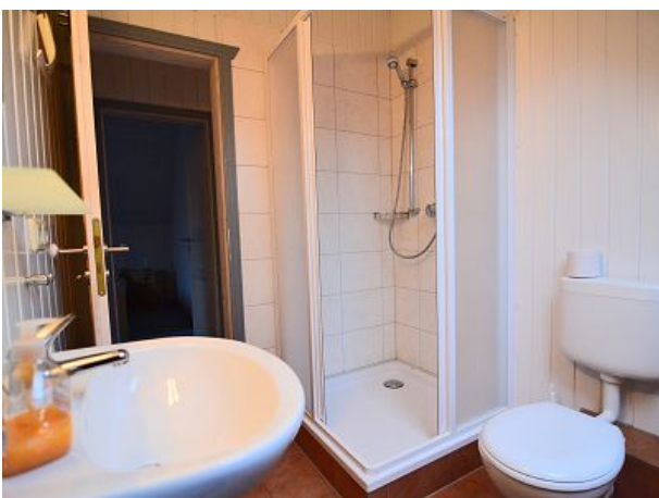
Bad OG Dusche