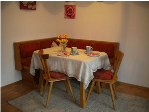
Essecke im Wohnzimmer