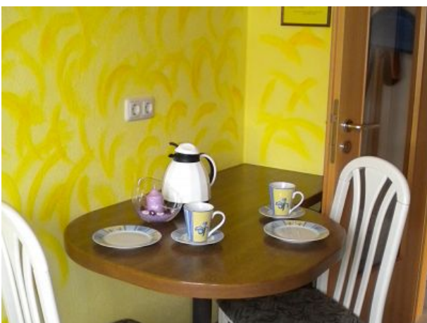
Kleiner Sitzplatz in der Küche