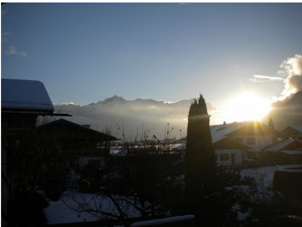
Blick vom Balkon Wettersteinmassiv