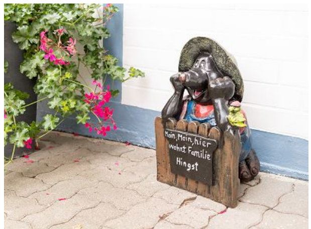
Herzlich Willkommen bei Familie Hingst