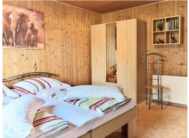
Alternativ Betten zusammengestellt