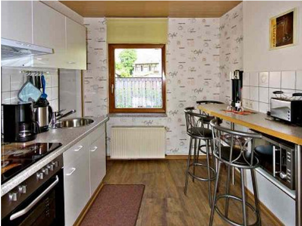
Komplett ausgestattete Küche