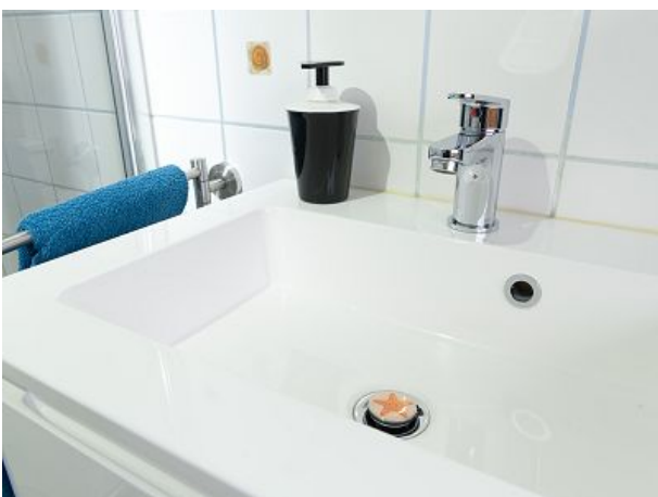
Sagrotan Seife zur Desinfektion