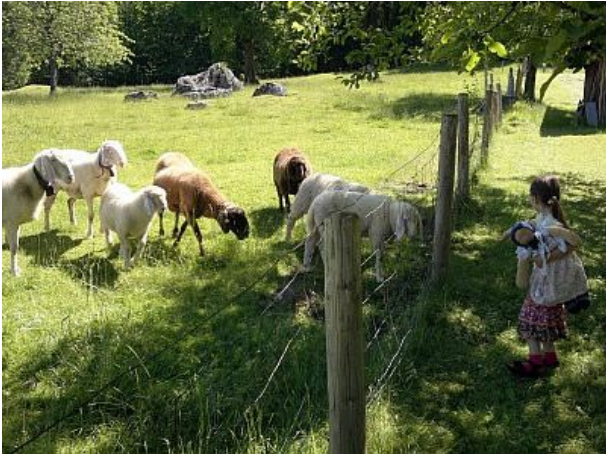
Direkt vor der Haustür