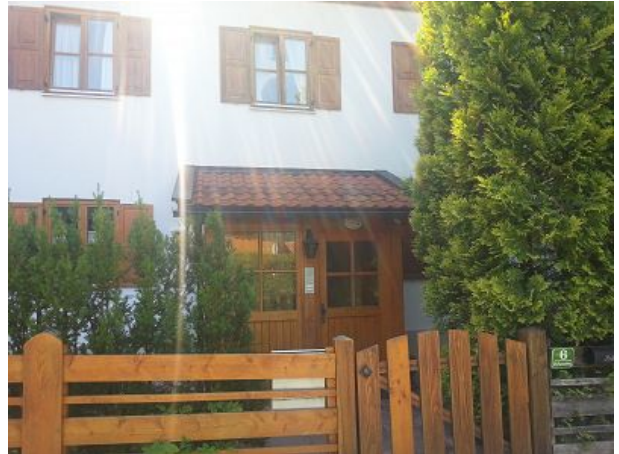
Herzlich Willkommen im Landhaus Volkmer