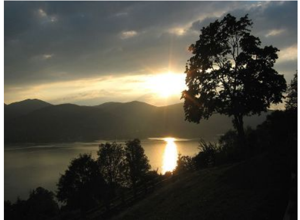
Abendstimmung am Tegernsee