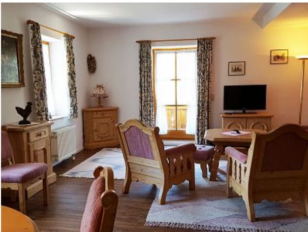
Wohnzimmer zum Ausspannen