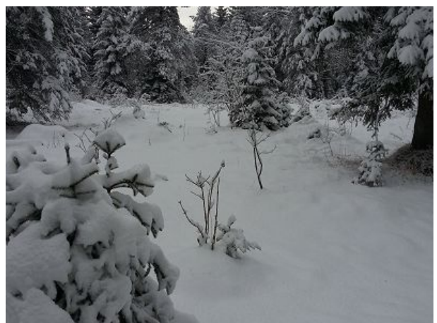
Die Weissach Auen im Winter