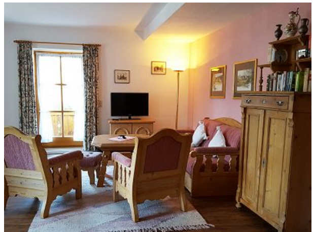
Wohnzimmer mit viel Platz