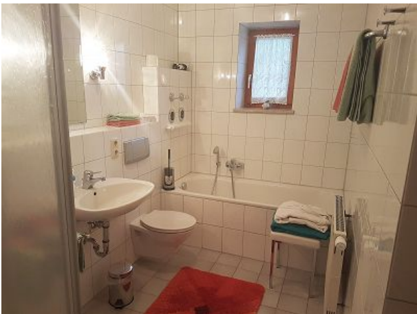
Bad mit Dusche und Wanne