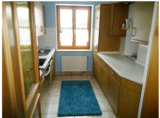
Küche voll ausgestattet