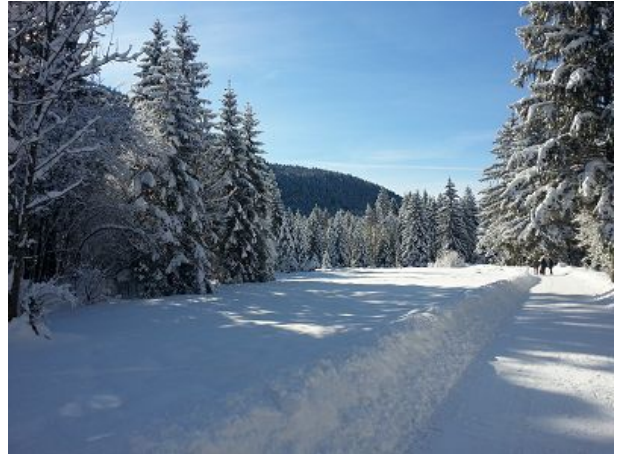
Spaziergang in den Auen im Winter