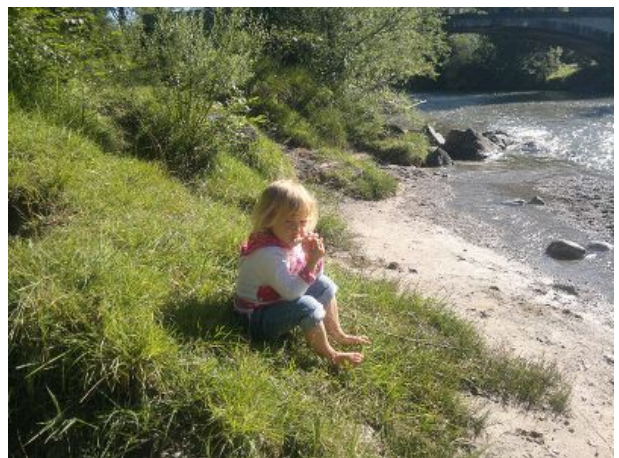
Relaxen an der Weissach