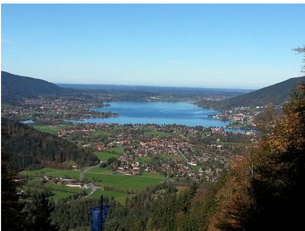
Der Tegernsee mit Blick vom Wallberg