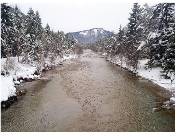
Die Weissach im Winter