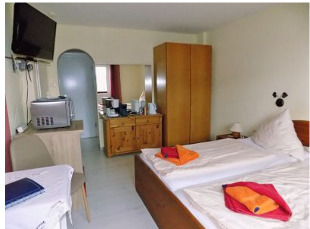
Dz mit Bad und separatem WC