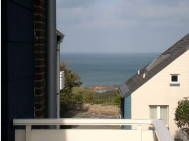
Balkon mit Meerblick