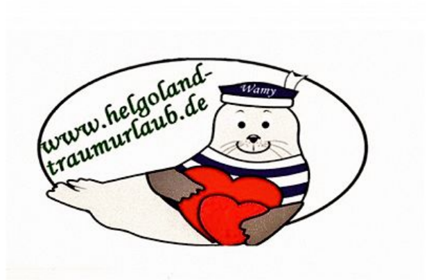
Logo Helgoland Traumurlaub