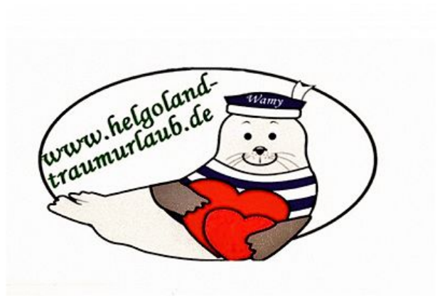
Logo Helgoland Traumurlaub