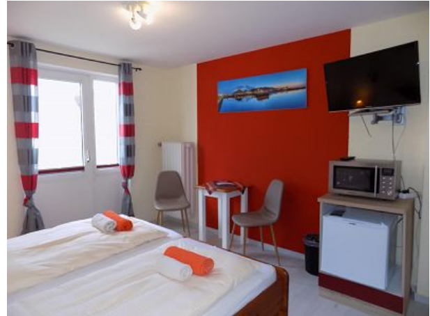
Dz Lumme mit Kücheneinrichtung ohne Herd