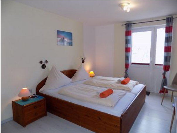
Dz Lumme Haus Ahrens