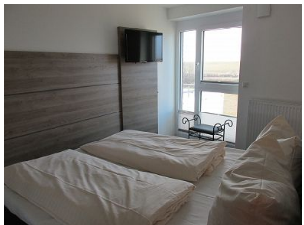
Schlafzimmer Betten sind bezogen