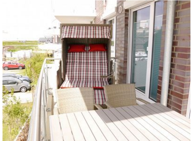
Strandkorb Balkon Mai bis September