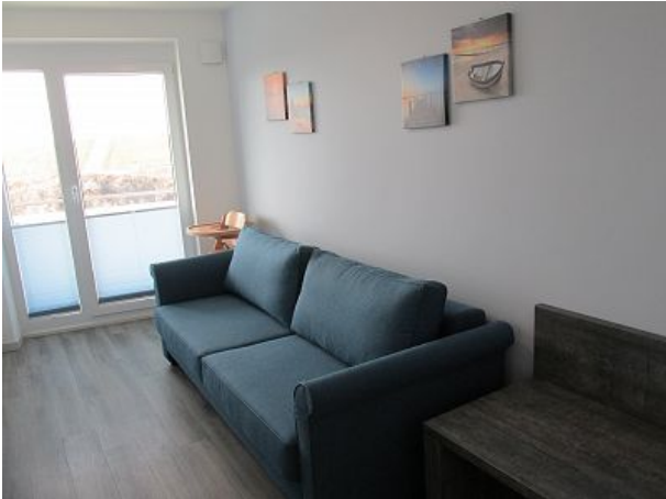
Schlafzimmer mit Couch