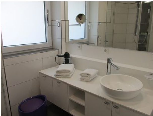
Duschbad mit Handtücher