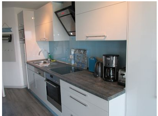
Küche mit Geschirrspüler