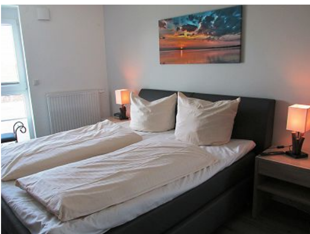
Schlafzimmer mit TV