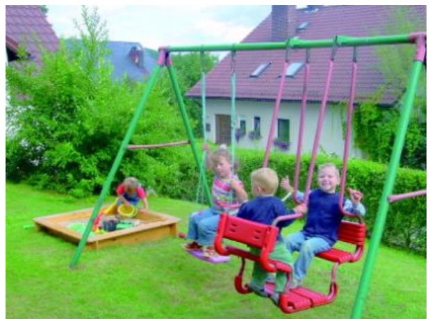
Sandkasten und Schaukel