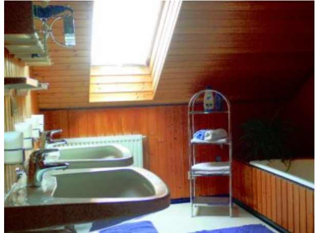
Bad Dusche WC