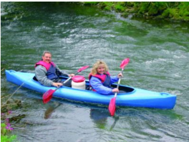
Kajakfahren in der Nähe