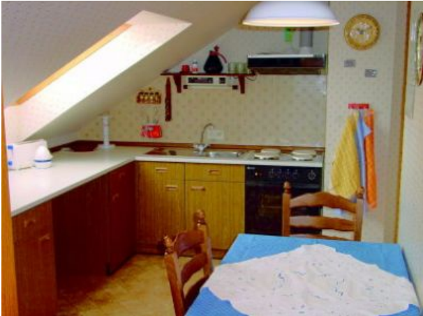
Küche mit Essecke