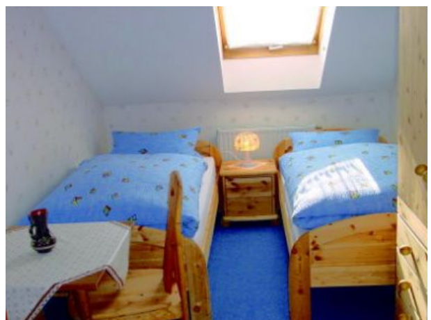
Schlafzimmer mit zwei Betten