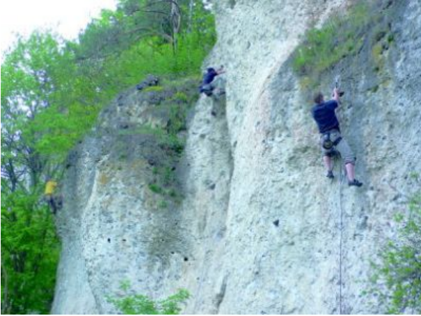
Klettern in der Nähe