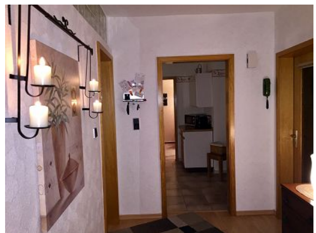
Eingangsbereich in der Ferienwohnung