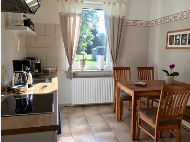
Küche mit Blick in den Garten