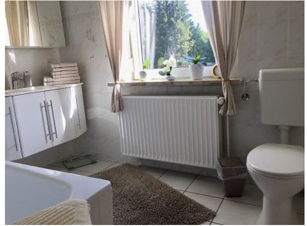
Bad mit Gartenblick