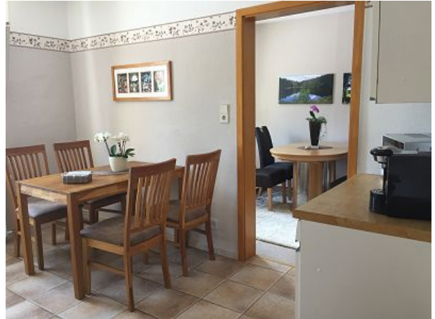
Blick von der Küche in das Esszimmer