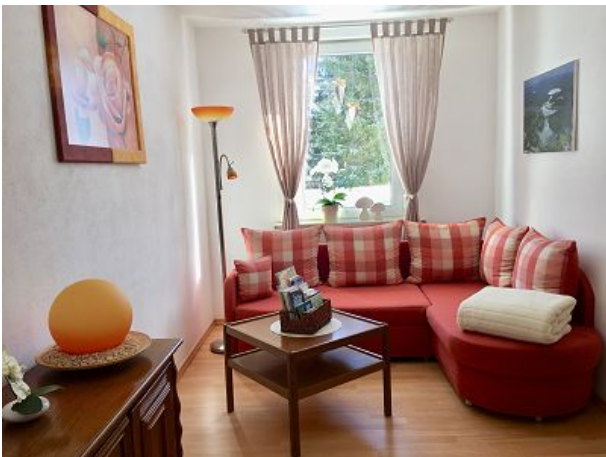
Lesezimmer mit Schlafcouch