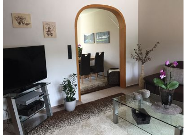
Blick vom Wohnzimmer in das Esszimmer