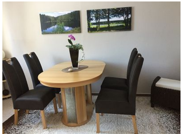
Sitzplatz im Esszimmer