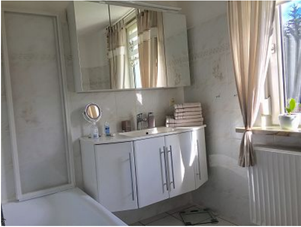
Bad mit Badewanne und Duscheinrichtung