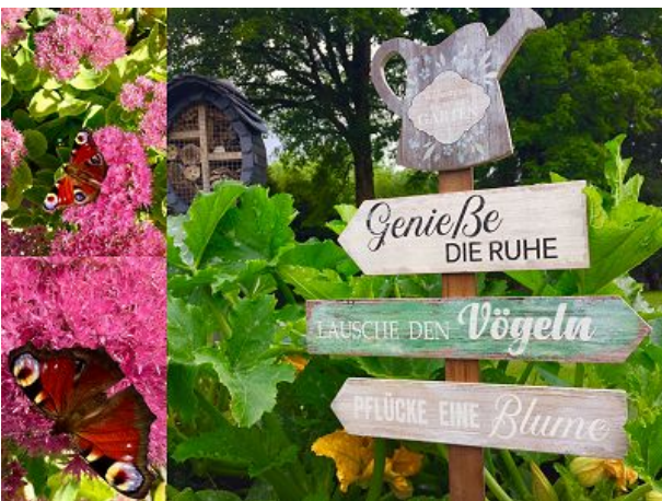
Oase der Ruhe