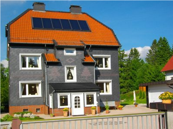
Wohnhaus mit Ferienwohnung