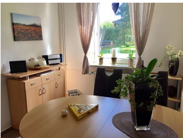
Esszimmer mit Gartenblick