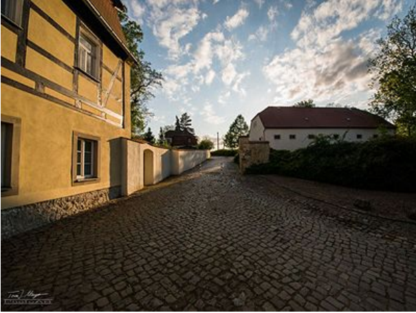
Bis bald mal wieder