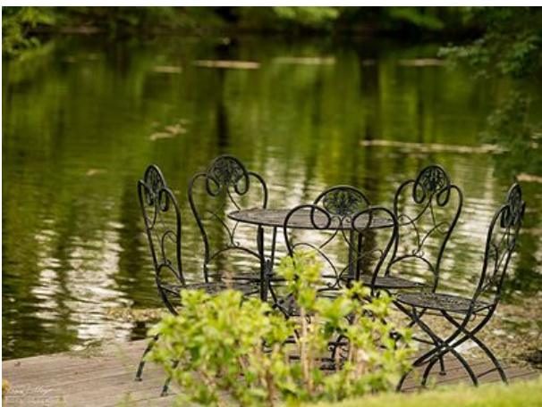
Steganlage am Teich