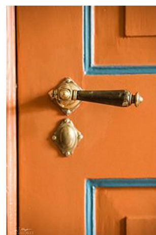
Türen im alten Bestand