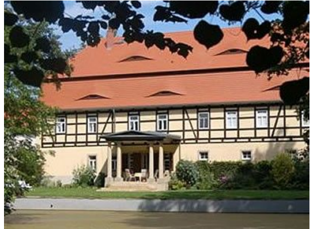
Herrnhaus mit Porta