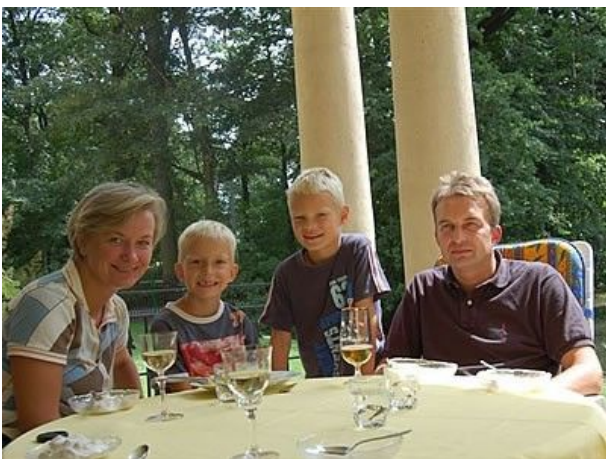
entspannen auf der Porta