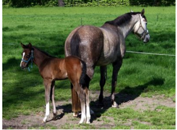
Pferde auf unseren Wiesen