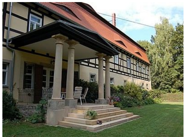
Porta im Garten