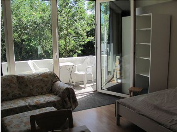
Blick von der Küche zum Südbalkon