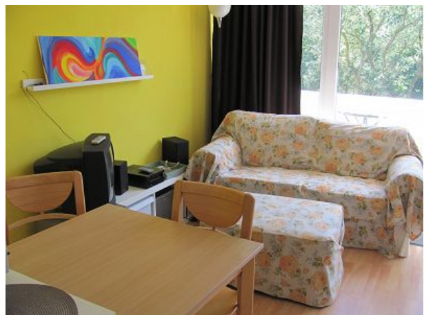
Wohnbereich mit Essplatz