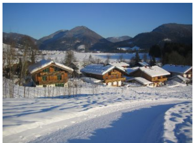
Blick aufs Haus vom Winterwanderweg