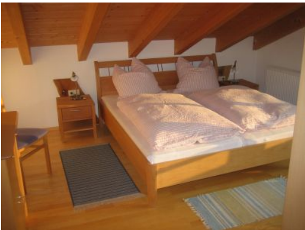
Schlafzimmer FEWO eins