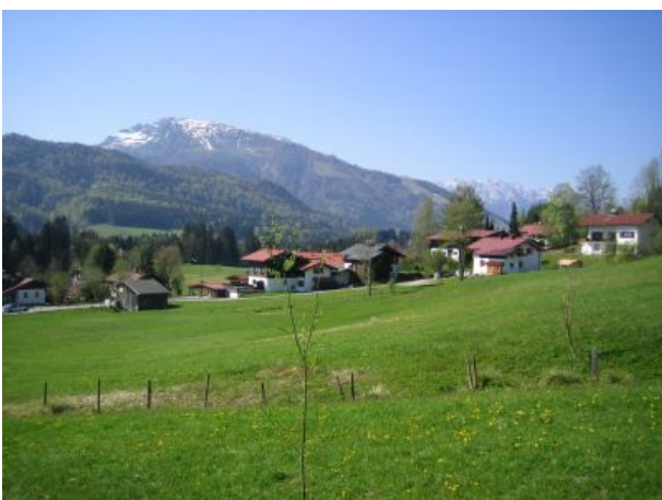
Blick nach Südwesten zum Unterberghorn