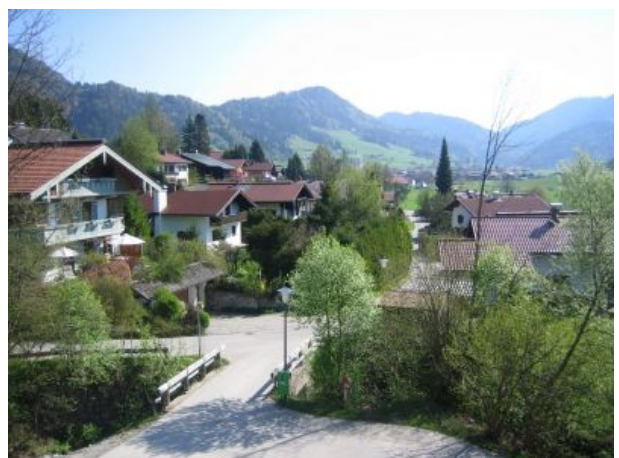
Blick vom Balkon FEWO zwei und drei