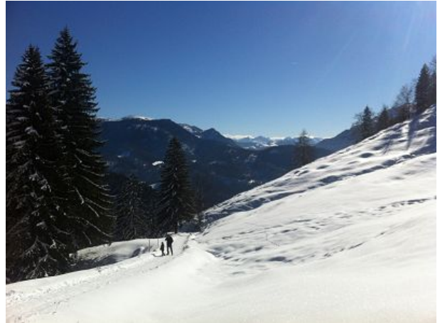
Blick Richtung Großglockner