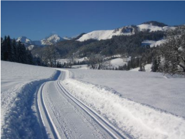
Herrlich präparierte Loipen