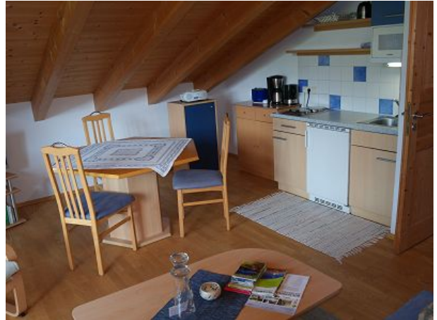
Küchenzeile und Esstisch FEWO eins