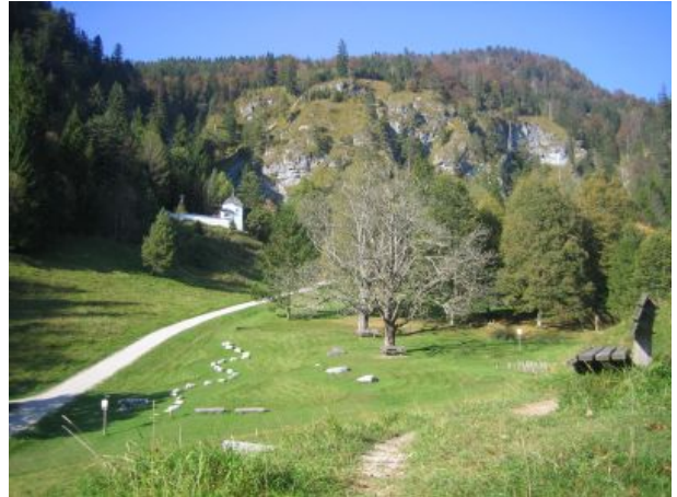
Kriegerkapelle und Barfußpark