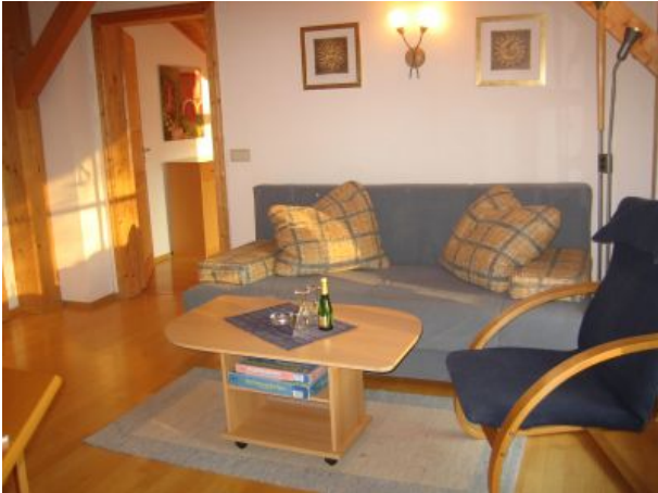
Wohnzimmer FEWO eins