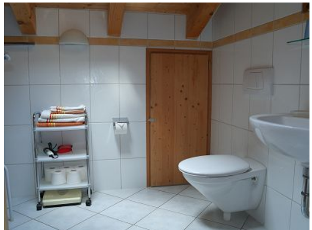
Badezimmer FEWO eins