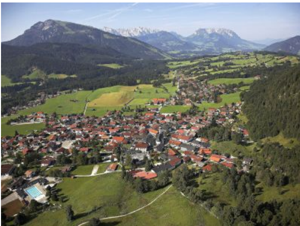
Reit im Winkl Blick zum Kaisergebirge