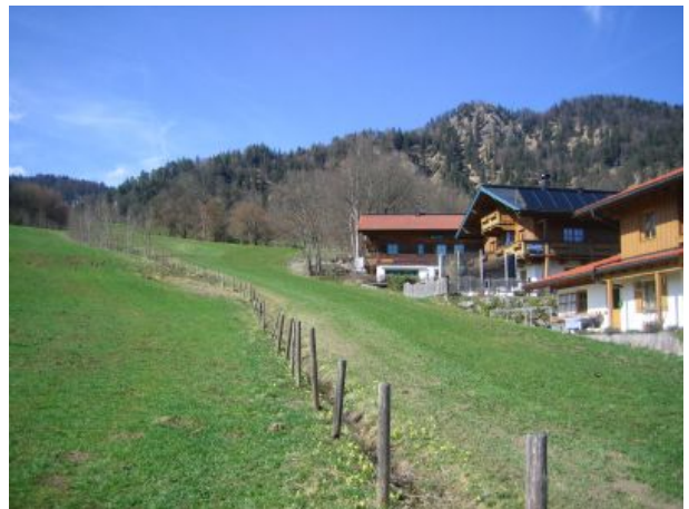
Blick von der Straße oberstes Haus