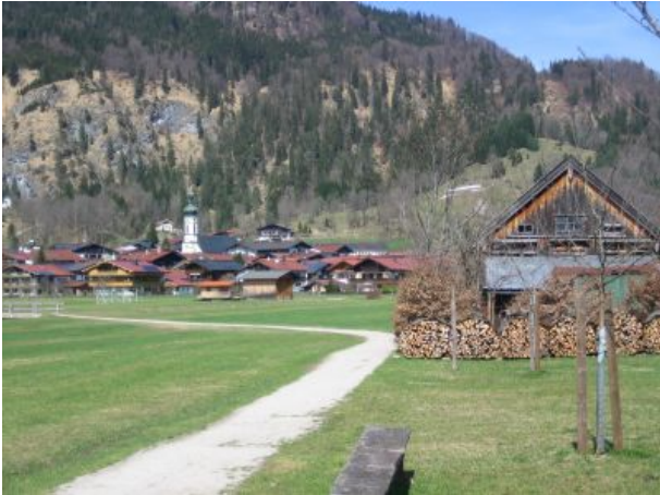
Blick Richtung Ortskern Reit im Winkl