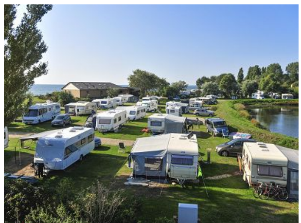
Stellplätze an der Landzunge