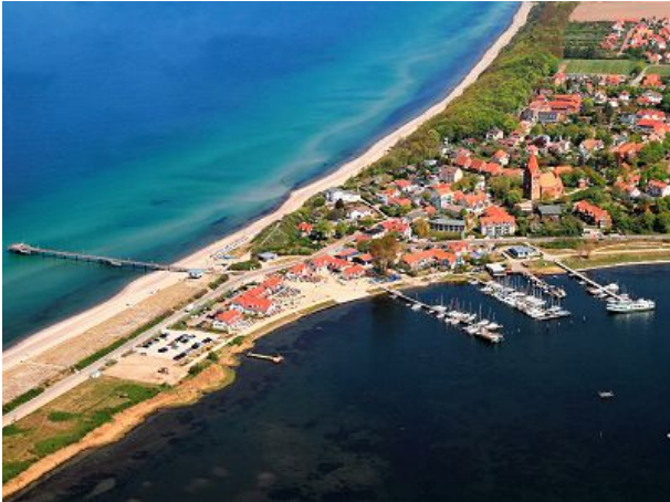
Ostseebad Rerik aus der Luft