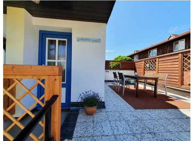
Terrasse für die Wohnung Frieda