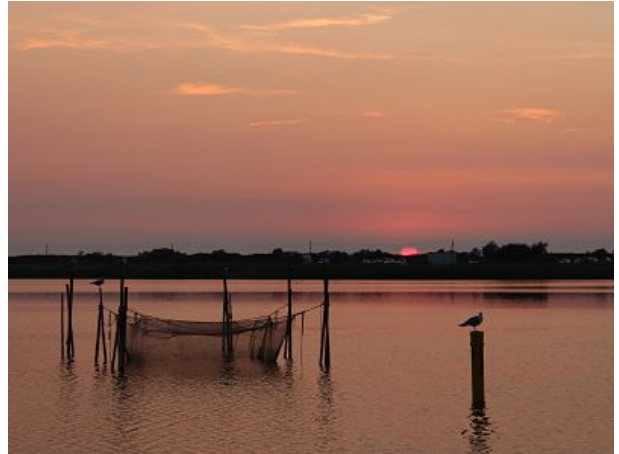
Sonnenuntergang am Salzhaff