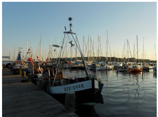
Fischereianleger am Salzhaff