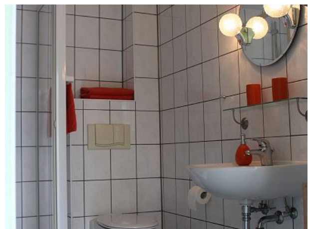
Du mit WC