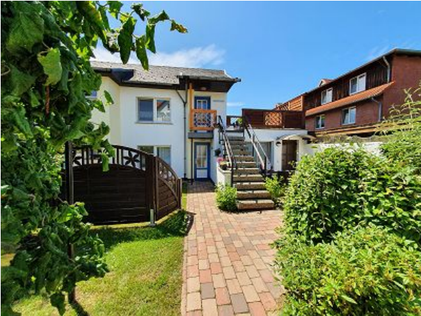
Ferienhaus mit Fritz und Frieda