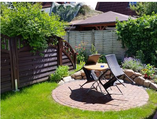
Terrasse für die Wohnung Fritz