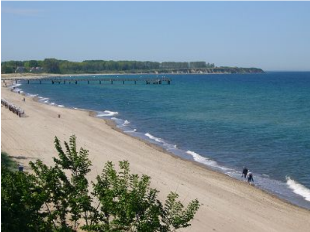
Naturstrand mit Steilküste