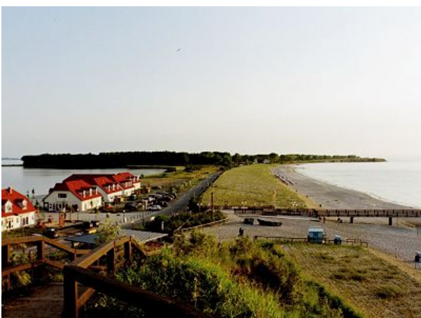
Zwischen Salzhaff und Ostsee