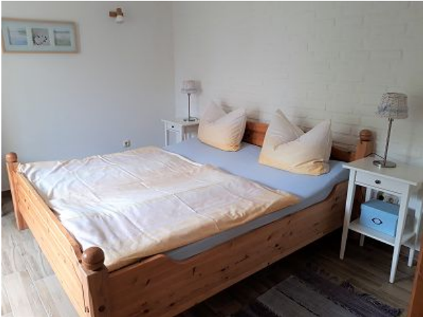
Schlafrum mit Doppelbett Fritz