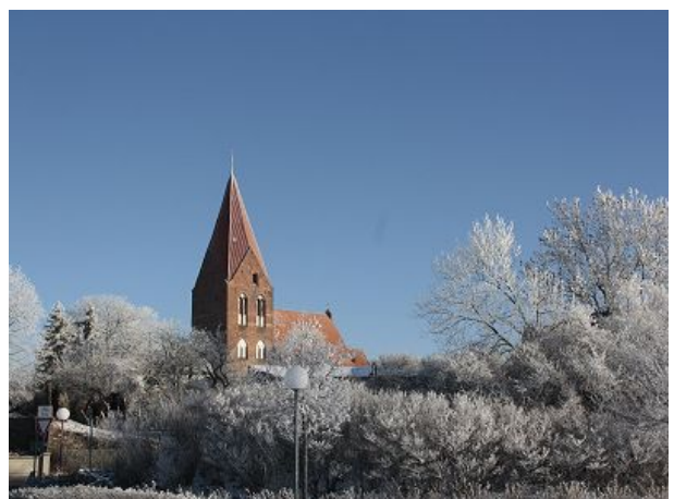
Auch im Winter schön