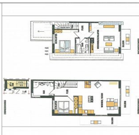
Grundriss - Ober- und Dachgeschoss