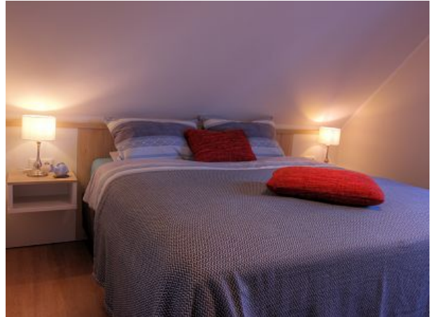
Das Schlafzimmer im Dachgeschoss