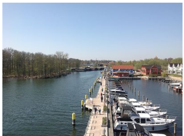
Blick auf die Eldeefahrt