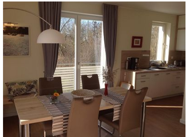
Essecke mit Blick auf die Küchenzeile