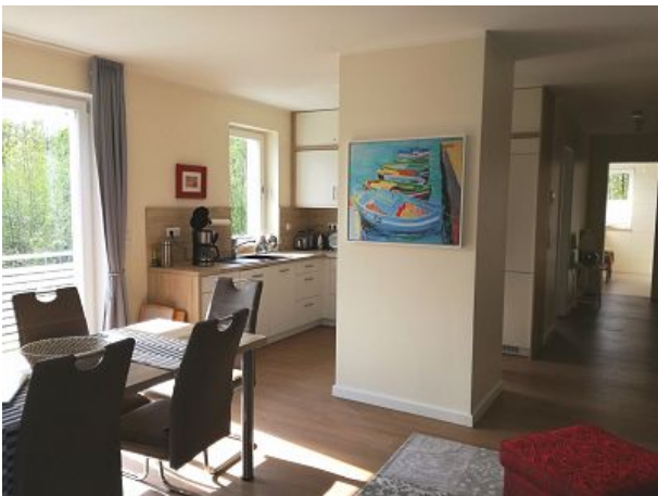
Die Wohnung ist lichtdurchflutet