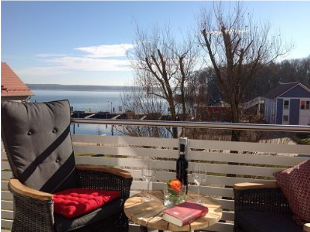
Entspannung mit Blick auf den See