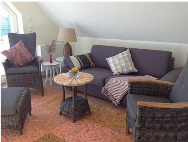
Die Sessel dürfen auch auf den Balkon