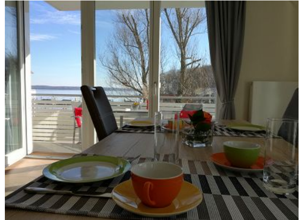
Essecke mit Seeblick