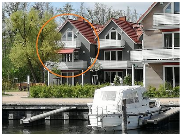
Nah am Wasser