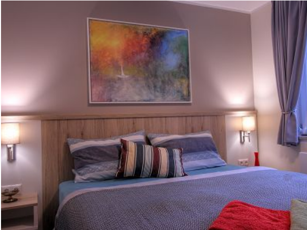
Das Schlafzimmer im Obergeschoss