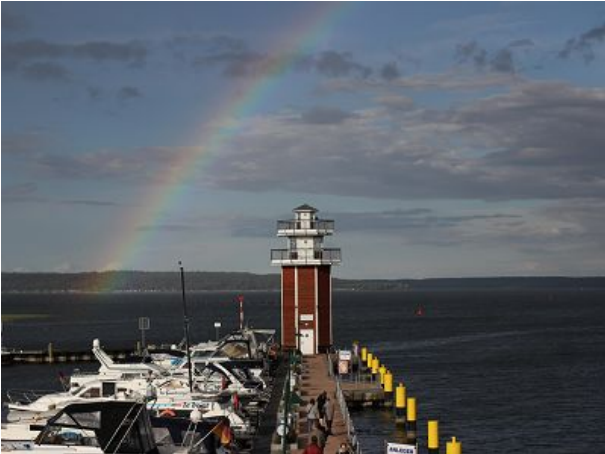
Der Leuchtturm von Plau