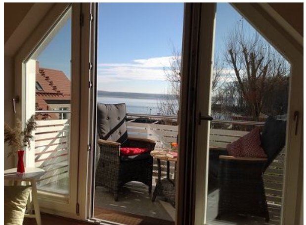
Entspannung mit Blick auf den See