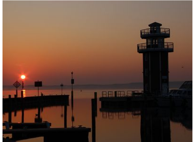
Sonnenaufgang am Plauer See