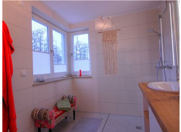
Das Badezimmer im OG mit Dusche