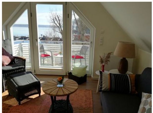
Das Wohnzimmer mit Seeblick