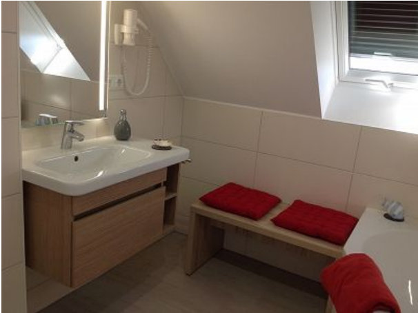
Das Badezimmer im DG mit Badewanne