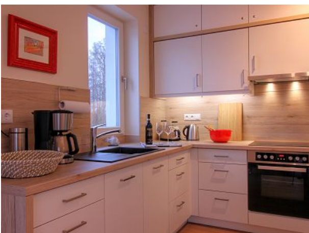
Die Küche ist liebevoll ausgestattet