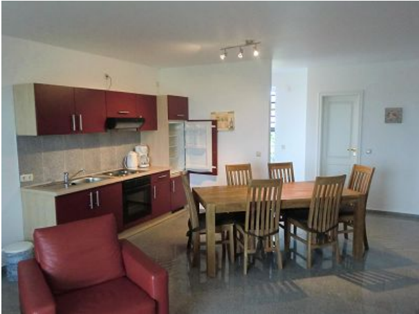
Küche und Esstisch