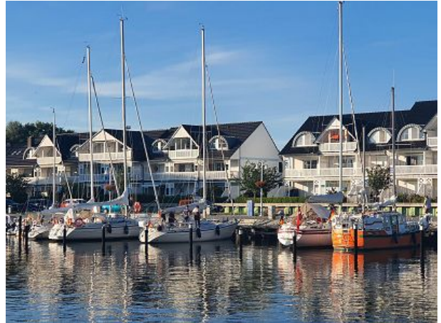
Preise und Infos hafenkiek-karlshagen.de