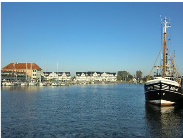
Yacht- und Fischerhafen