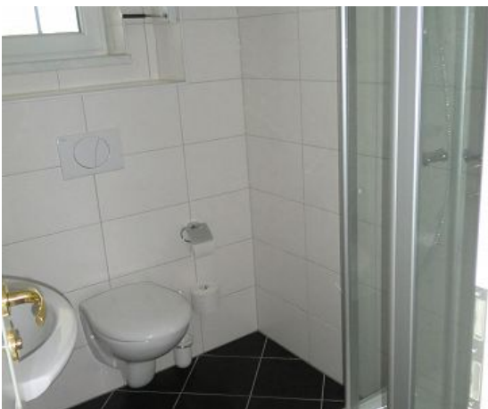
Bad mit Dusche zwei