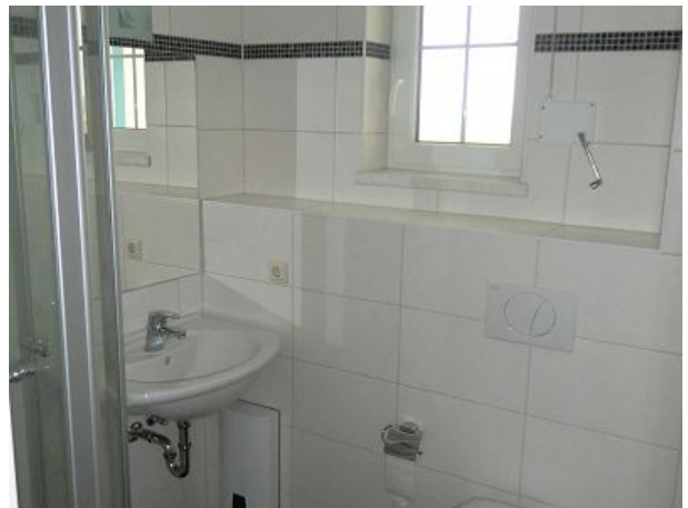
Bad mit Dusche eins