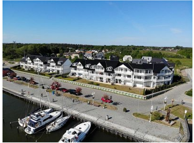
Preise und Info hafenkiek-karlshagen.de