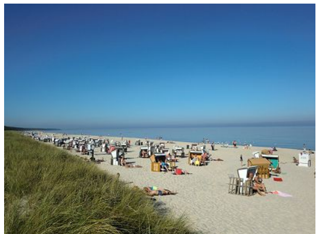
Breiter Ostseestrand Karlshagen