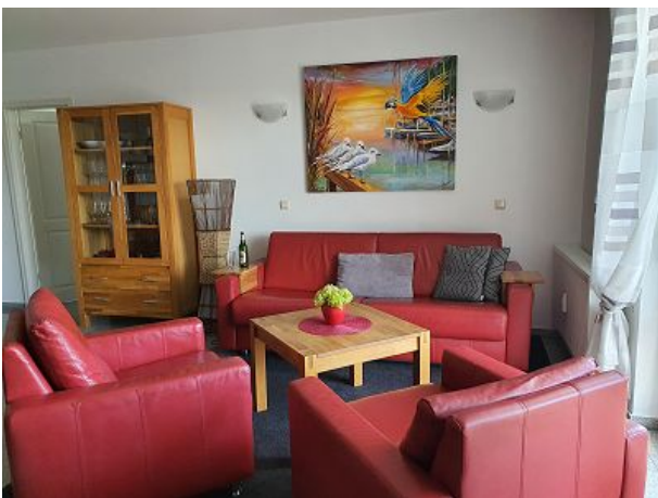
Preise unter hafenkiek-karlshagen.de