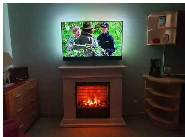
Kamin für die Gemütlichkeit