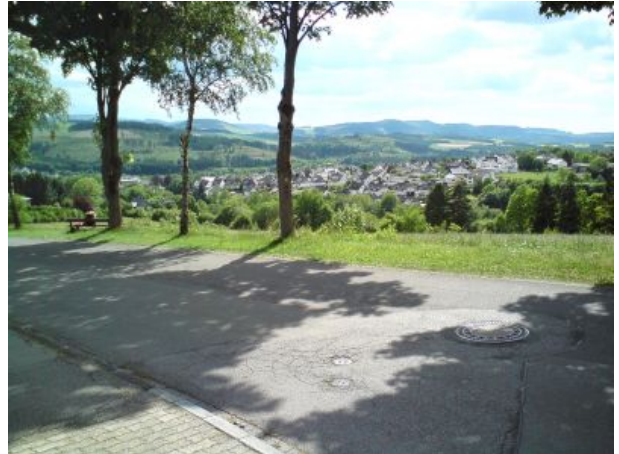
Blick auf Bad Fredeburg