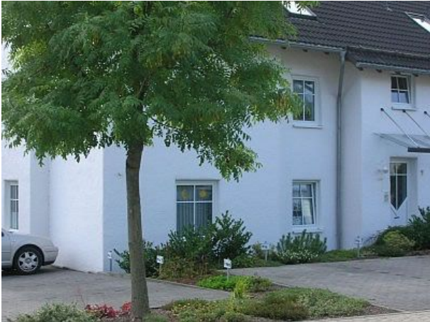
Haus im Sommer