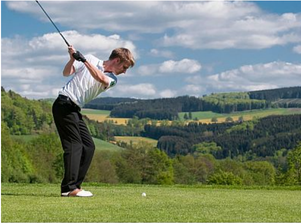
Golfplatz Winkhausen drei km entfernt