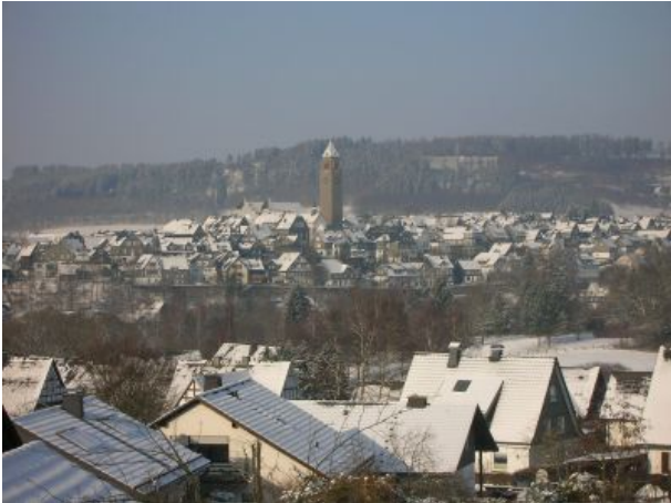
Blick auf die Stadt