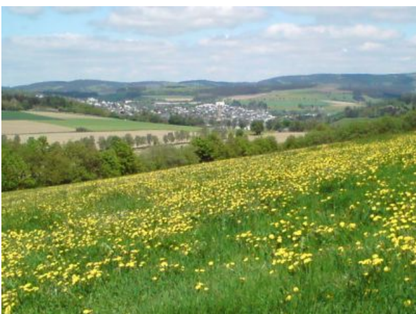
Blick auf Grafschaft