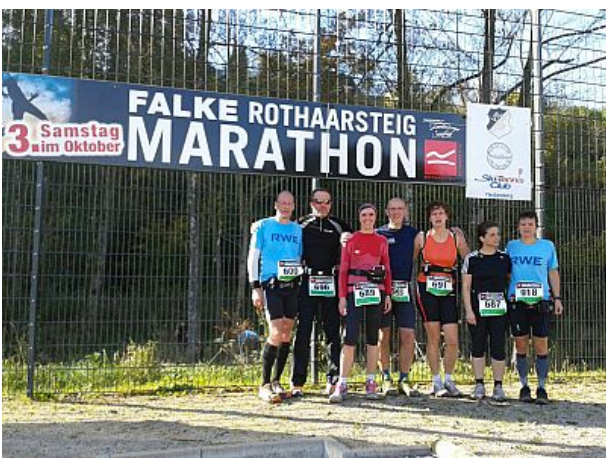
Falke Marathon immer im Oktober