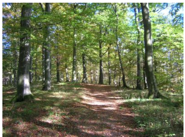
Aufstieg zum Wilzenbergturm