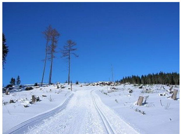
Loipen auf Schanze