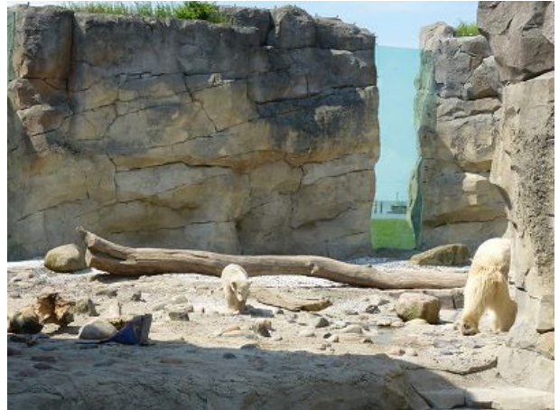
Zoo am Meer