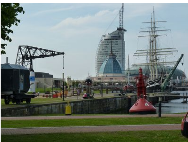
Blick auf den Alten Hafen