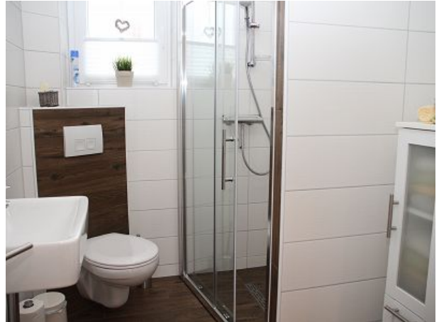
Toilette mit ebenerdiger Dusche