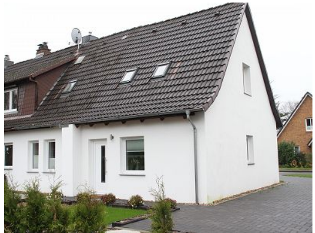
Eingangsbereich mit Parkplatz