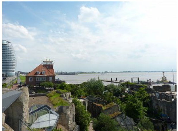
Zoo am Meer Blick Strandhalle