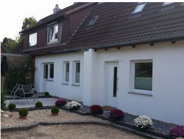
Eingang mit Terasse