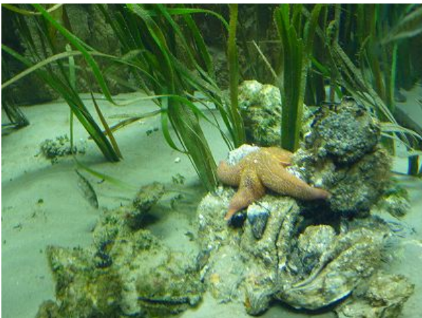
Zoo am Meer