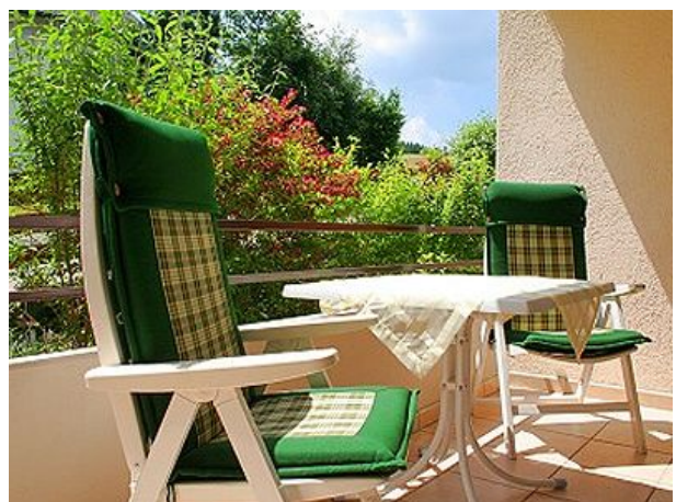
gemütliche Sitzecke auf dem Balkon