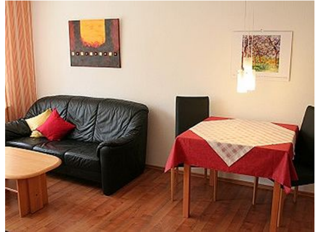
Esstisch ausziehbar und Sitzecke