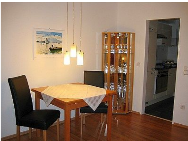
Essecke mit Blick zur Küche