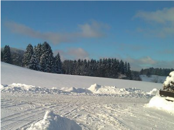
Winter im Hochschwarzwald