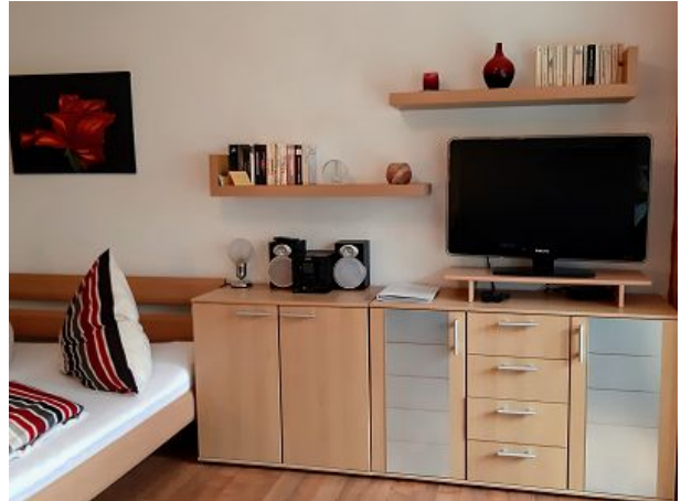
genügend Schränke und Schubladen