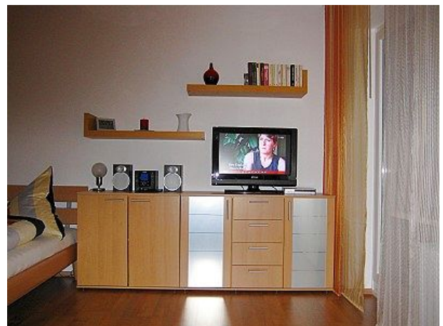
Blick von der Sitzecke zum Fernseher