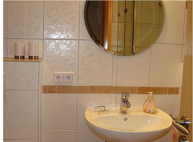
Blick ins Badezimmer