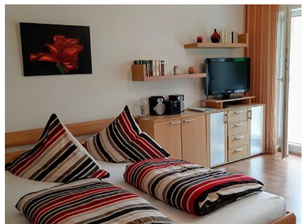
Bettroste sind verstellbar