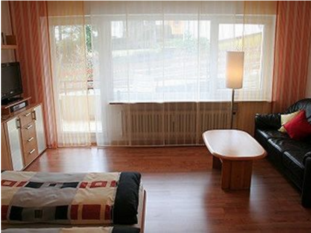
Schlafbereich und Sitzecke