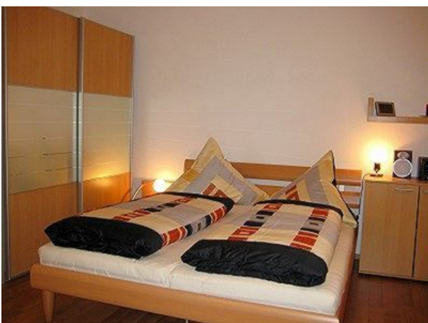
Schlafbereich - getrennte Matratzen