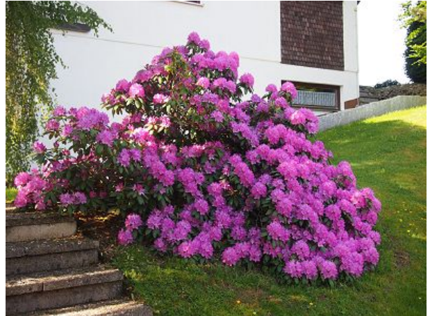
Blick zu unserem Haus gegenüber