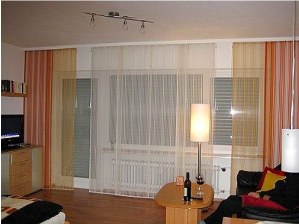
Blick Richtung Balkon