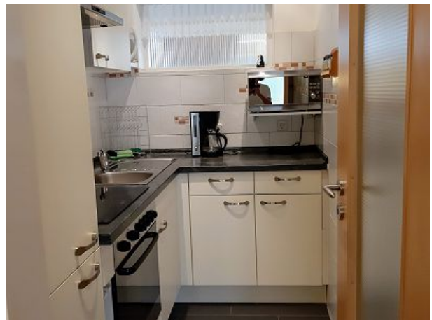
Gut ausgestattete Küche