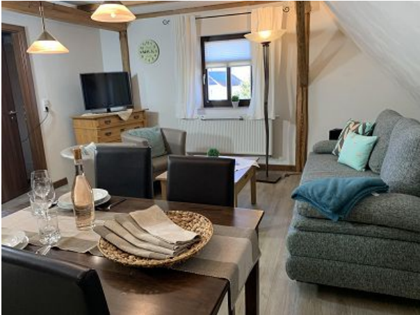
Blick in den Wohnbereich