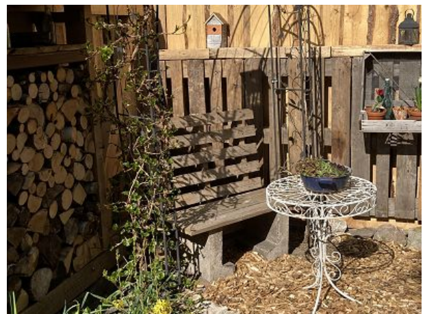
Platz an der Sonne