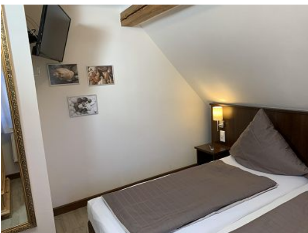
Schlafzimmer mit Flachbildschirm