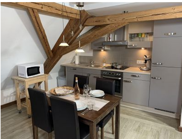
Küchenzeile und Essplatz