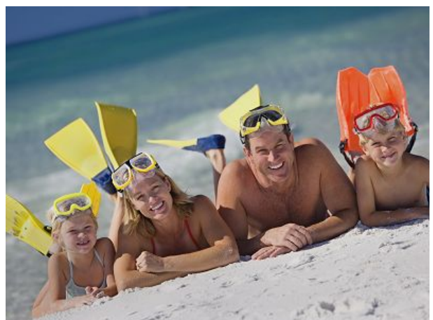
Badestrand auf der Landzunge