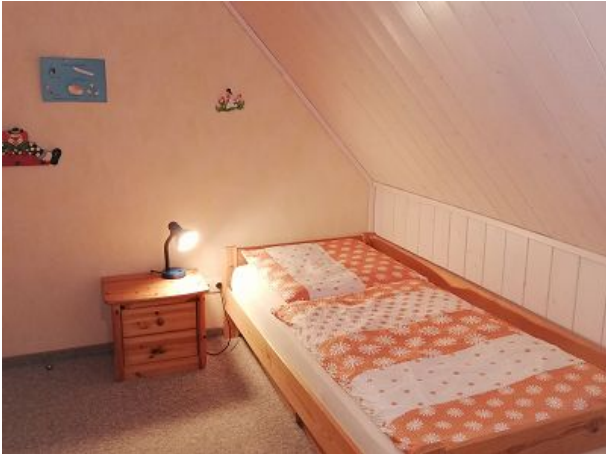
Einzelbett im Kinderzimmer