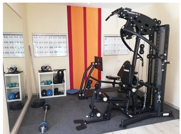
Kraftstation im Fitnessraum