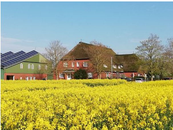
Hausansicht mit Rapsfeld