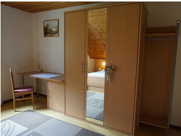
Schreibtischecke im Schlafzimmer