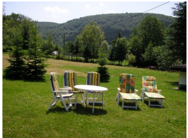
Blick ins Dhrontal