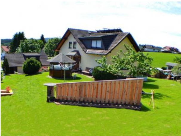
Haus-Trapp windgeschützter Freisitz