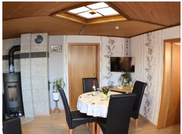
Wohnzimmer mit Kaminofen