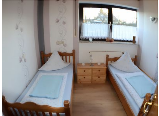
Schlafzimmer zwei einzel Betten