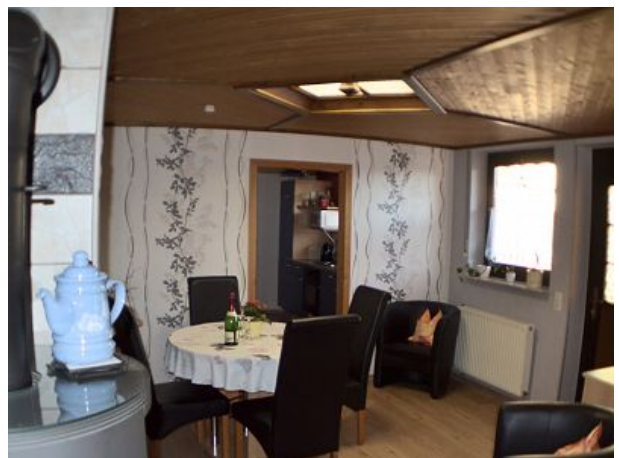
Wohnzimmer Blick zur Küche