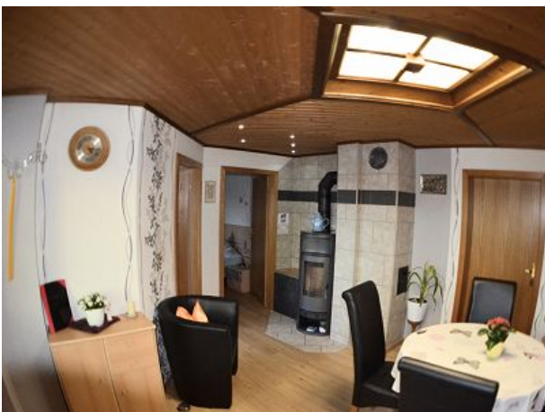
Wohnzimmer Blick zum Schlafzimmer