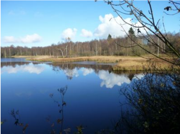
See am roten Moor