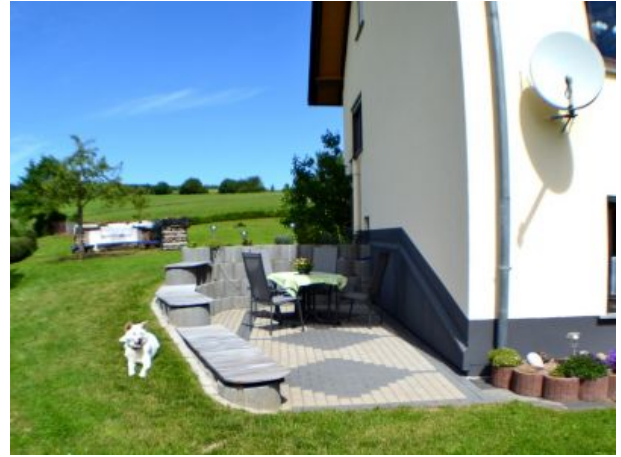
Sitzecke links von Wohnung