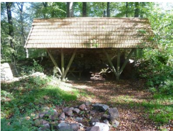
Rasthütte am Tannenfels