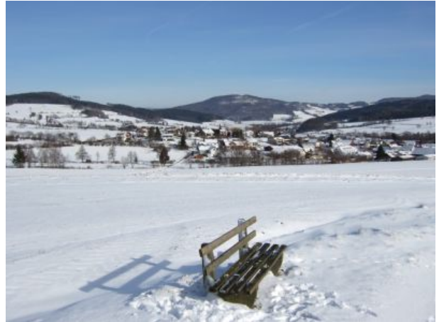
herrlich im Winter