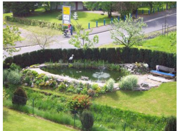
Gartenteich zum beobachten