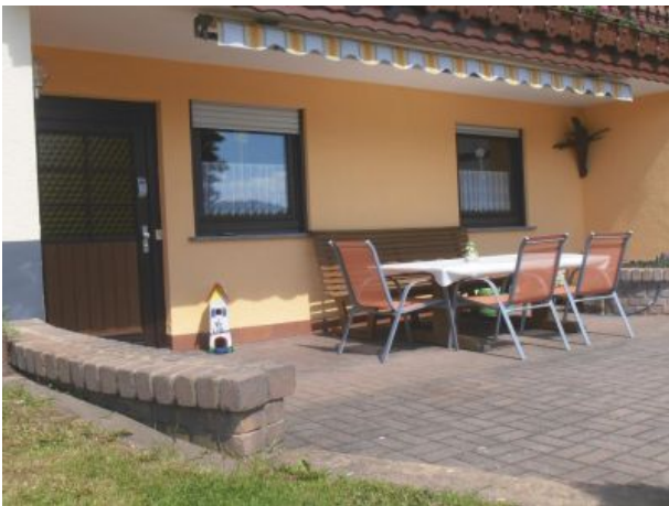
Sitzecke vor Wohnung