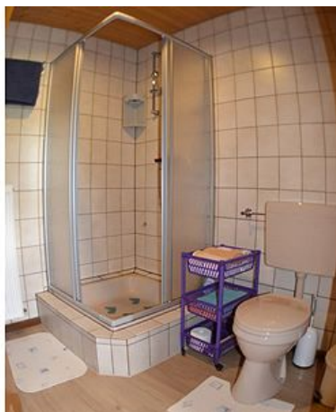
Bad - WC Dusche