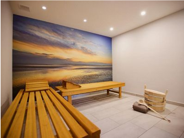
Ruheraum in der Sauna