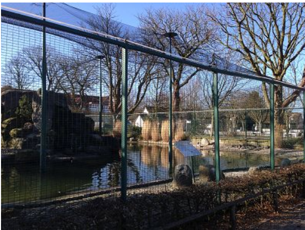
Vogelgehege im Kurpark