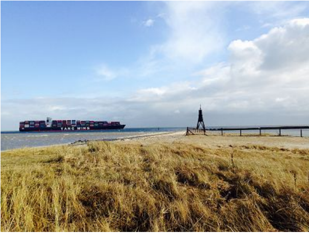
Kugelbake mit Containerschiff