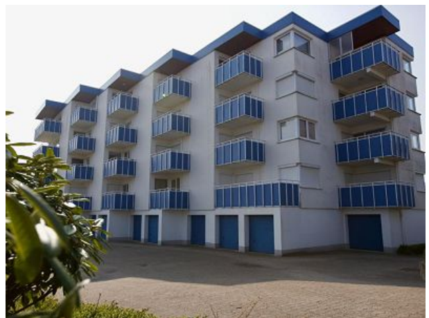
Ostansicht Haus Poseidon