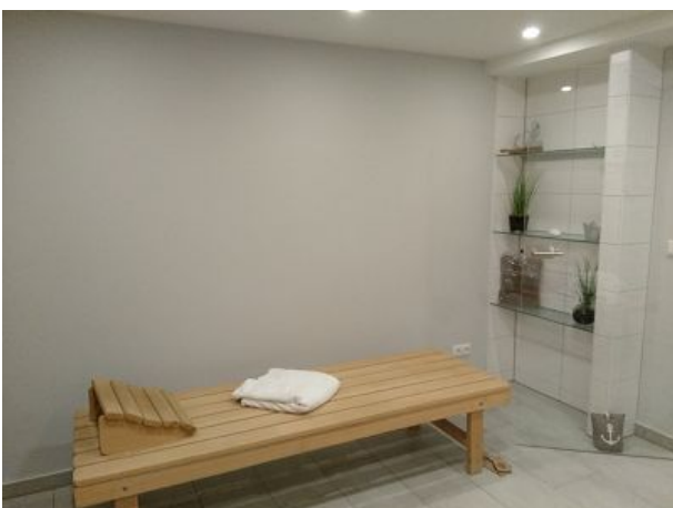
Im Januar folgen hier Zimmerfotos