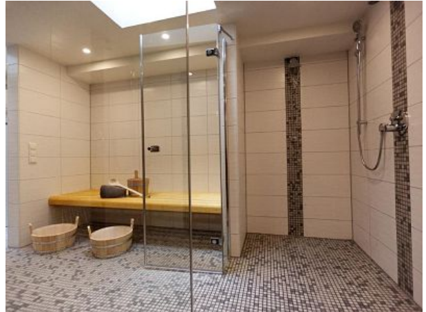
Duschbereich in der Sauna