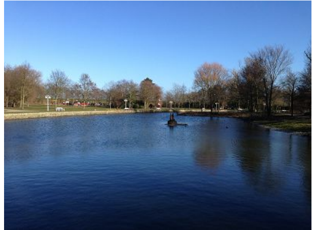
Kurpark in Döse