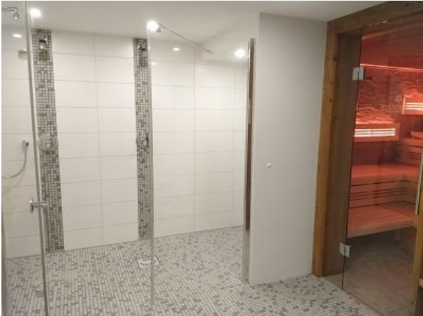
Im Januar folgen hier Zimmerfotos