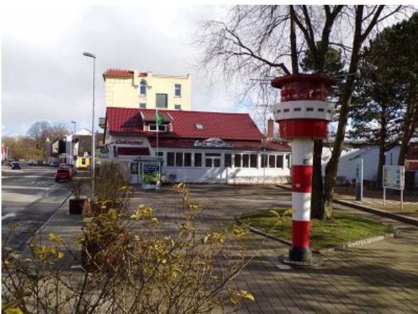
Leuchtturm auf dem Dorfplatz Döse