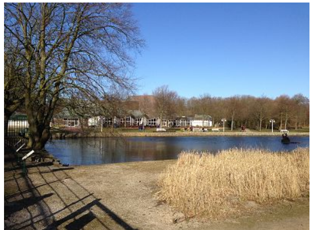
Veranstaltungszentrum Döse Kurpark