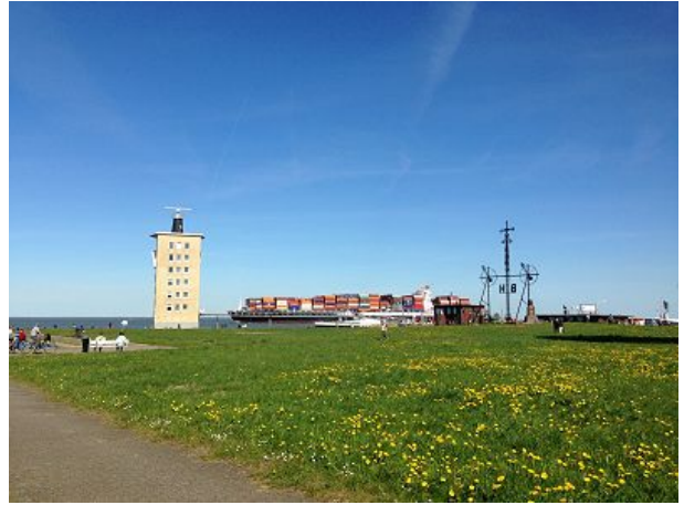
Semaphor für Helgoland und Borkum