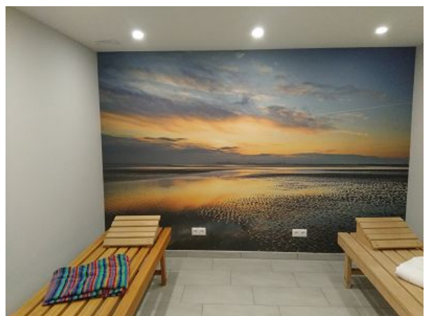
Im Januar folgen hier Zimmerfotos