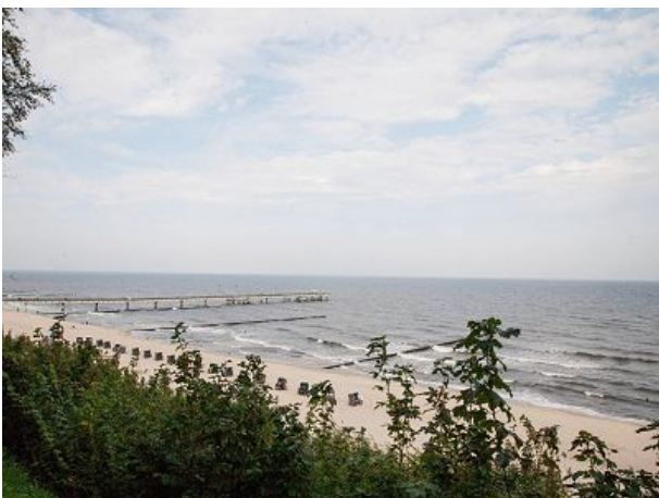
Blick von der Strandpromenade