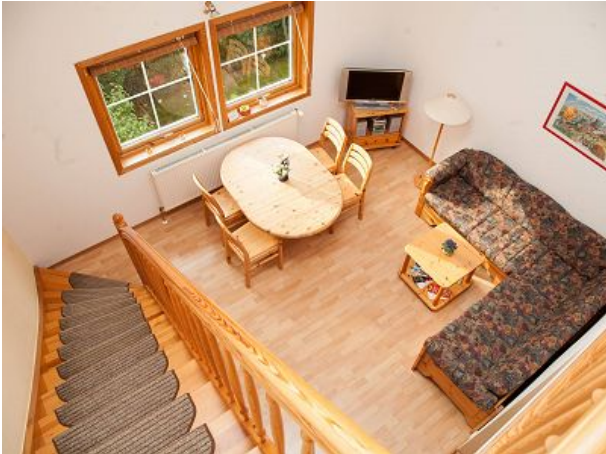
Blick von der Galerie