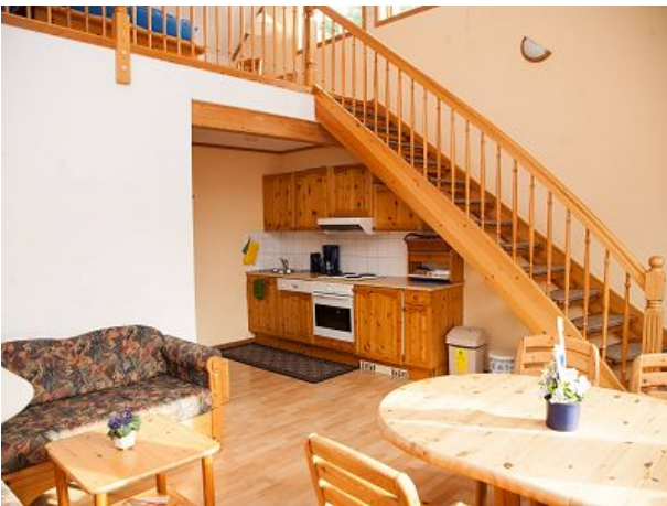
Aufgang zur Schlafgalerie