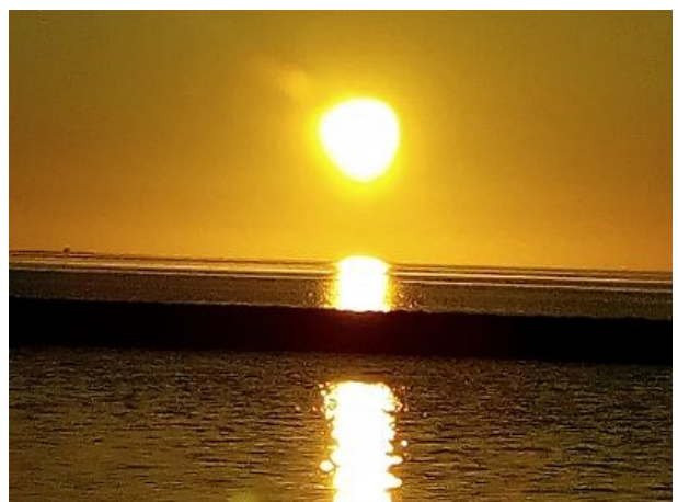
Sonnenuntergang auf Pellworm