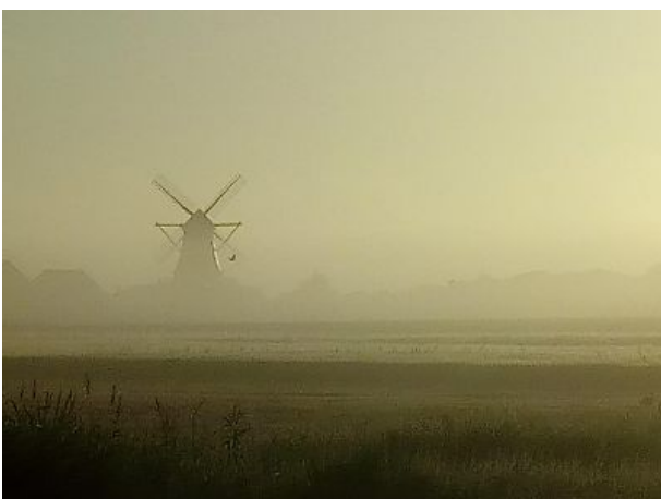
Die Nordermühle im Morgennebel