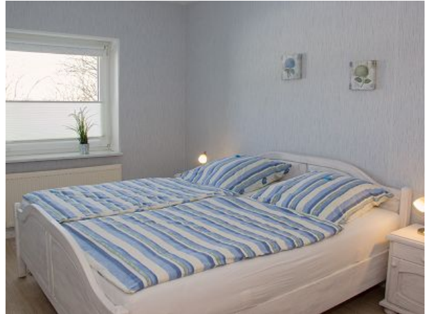
Schlafrum mit Doppelbett