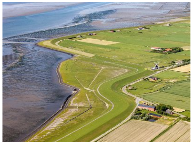
Luftaufnahme vom Ferienhof