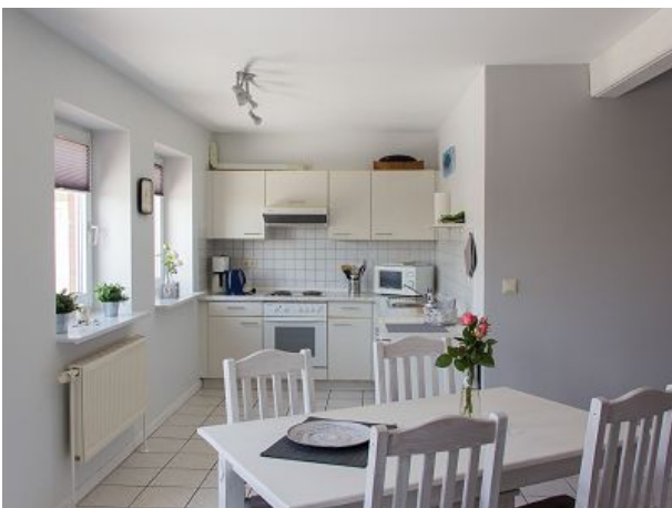
Küche angeschlossen an den Wohnbereich