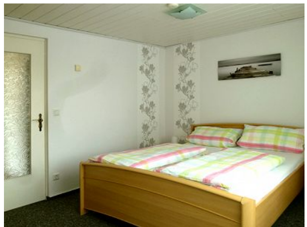
Schlafzimmer Feha Bergblick