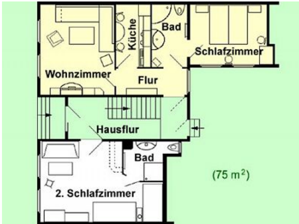
Grundriss der FEWO Familienurlaub