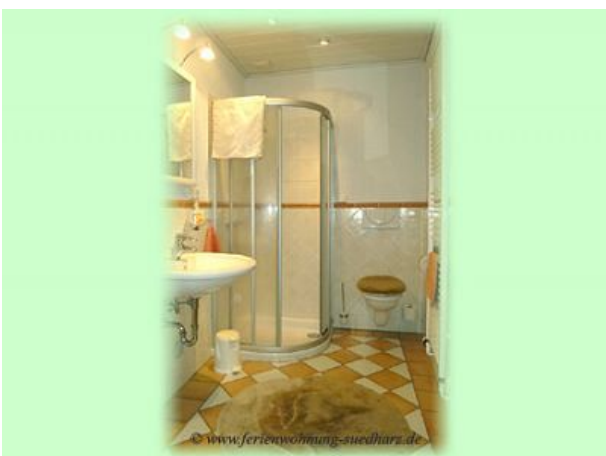
Duschbadder FEWO Familienurlaub