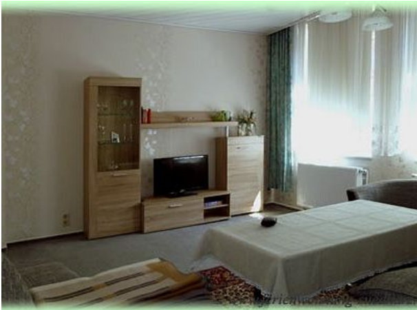
Wohnzimmer der FEWO Familienurlaub