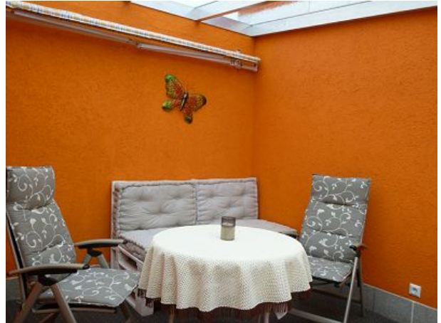
Terrasse Feha Bergblick