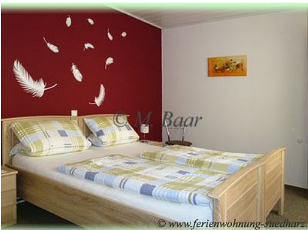
Schlafzimmer der FEWO Familienurlaub