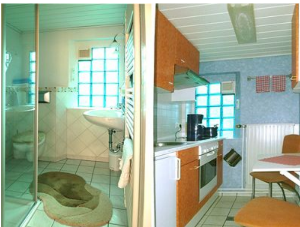
Duschbad und Küche Feha Bergblick