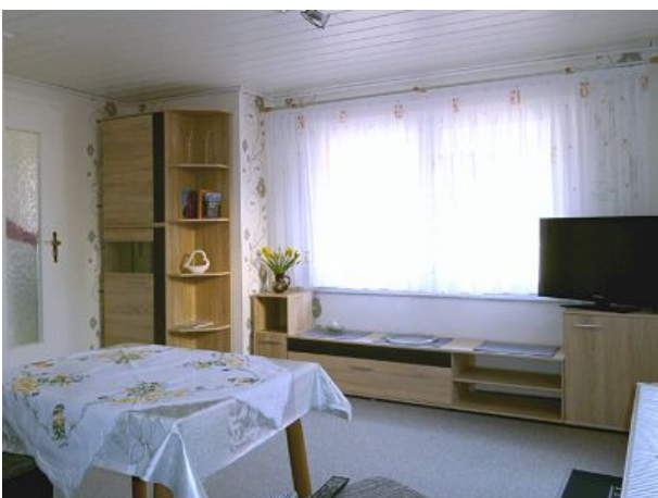
Wohnzimmer Feha Bergblick