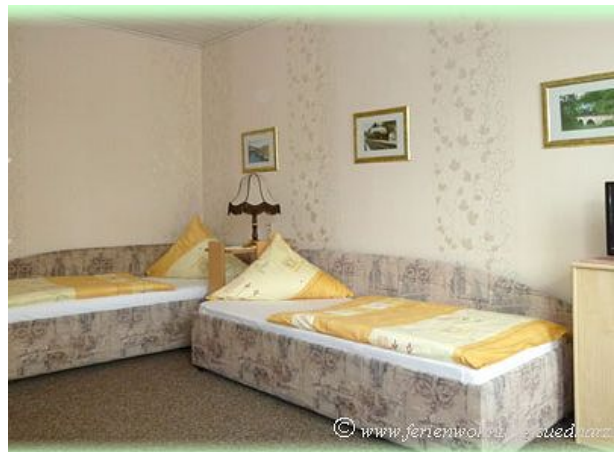
Schlafzimmer der FEWO Familienurlaub