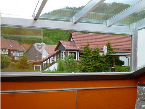
Terrasse Feha Bergblick