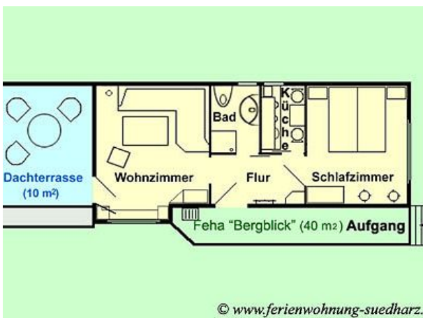
Grundriss Feha Bergblick