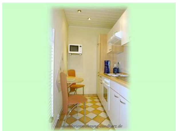
Küche der FEWO Familienurlaub