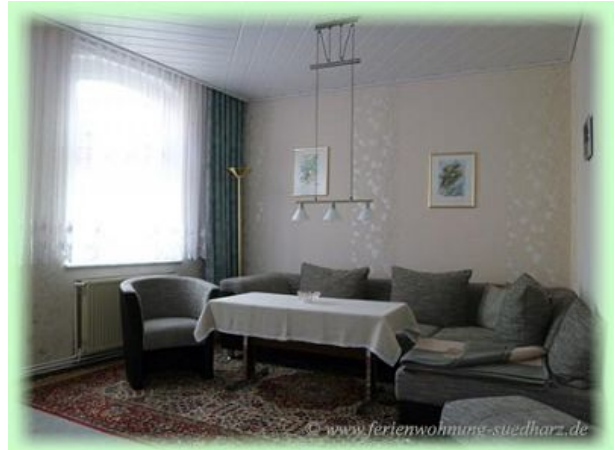
Wohnzimmer der FEWO Familienurlaub