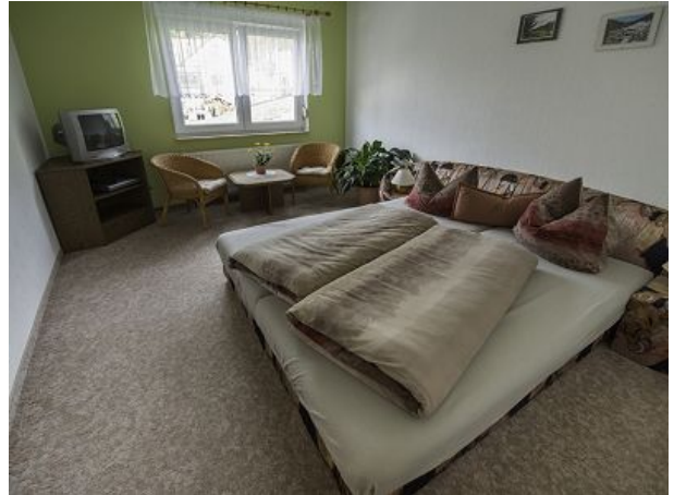
Doppelzimmer in FEWO