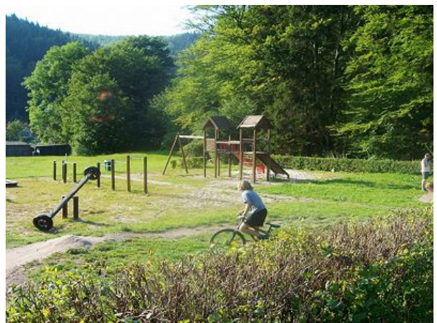
Spielplatz in hundert Metern