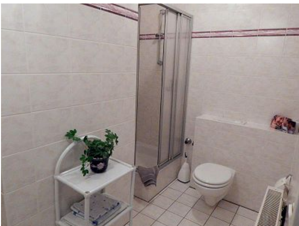
Dusche mit Toilette