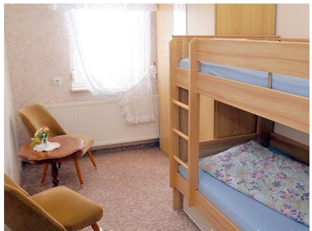
Hochbett in FEWO