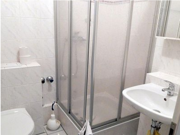
Dusche Bad Beispiel