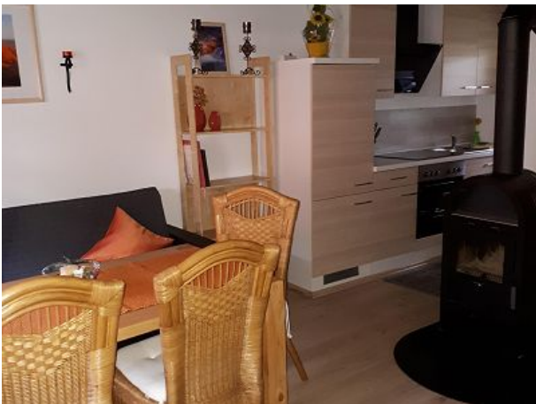
Küche mit Kaminofen