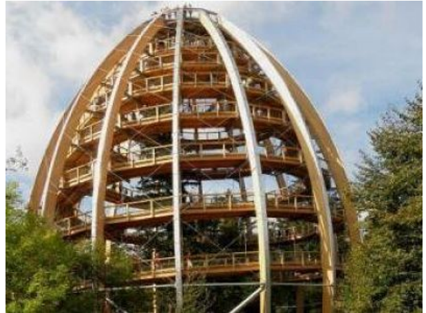
Baumwipfelpfad Nationalpark Bay Wald