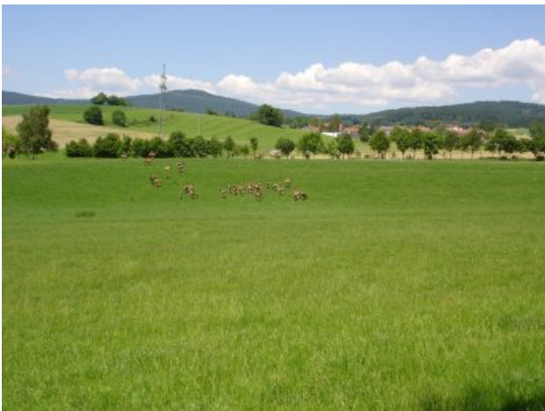
Wildgehege mit Blick nach Eppenschlag