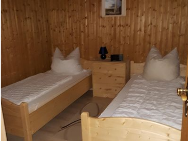
Schlafen getrennte Betten