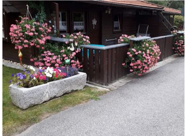
Terrasse Haus Tamara